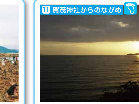
国指定重要文化財である賀茂神社からの眺めは、シーボルトが「日本で見ただけで最も美しい景色のひとつ」と絶賛したことで有名です。