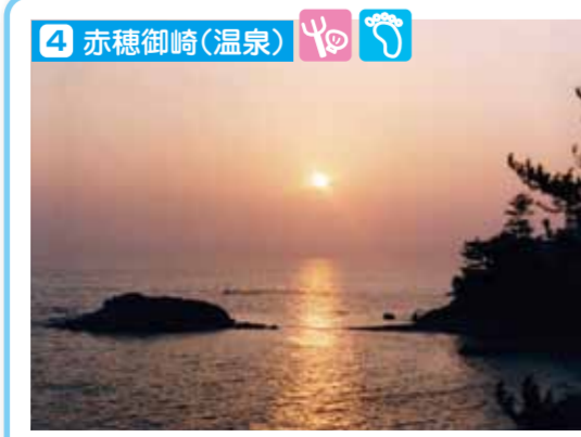
瀬戸内海国立公園に面する御崎は温泉地でもあります。ここから望む夕日は「日本の夕陽百選」に選ばれています。