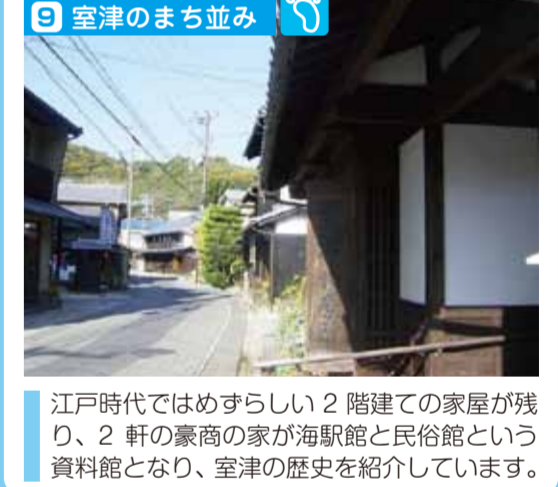
江戸時代ではめずらしい2階建ての家屋が残り、2軒の豪商の家が海駅館と民俗館という資料館となり、室津の歴史を紹介しています。