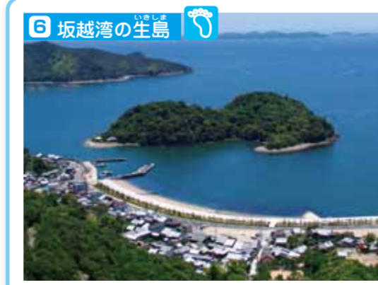
大遊神社の神地として入島が禁じられています。原生樹林が繁茂し、国の天然記念物に指定されています。