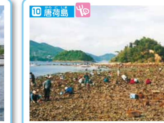
室津の沖合に浮かぶ3つの島で、山部赤人がこの島を詠んだ歌が「万葉集」におさめられています。大潮のとき、沖側の2つの島は陸続きになり、歩いて渡れます。