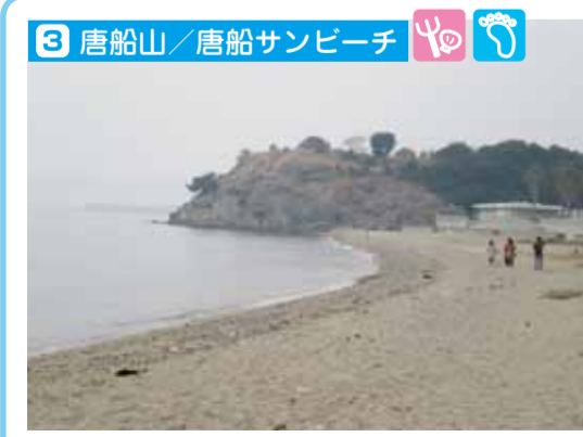
唐船山は標高19メートルの県下の最低峰で、瀬戸内海が眺望できます。唐船サンビーチでは潮干狩りや海水浴が楽しめます。