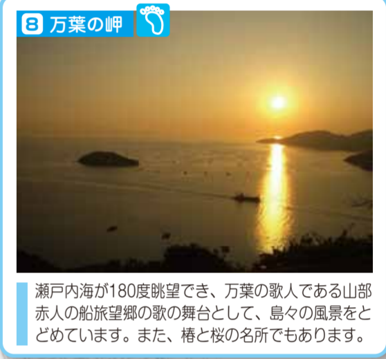
瀬戸内海が180度眺望でき、万葉の歌人である山部赤人の船旅望郷の歌の舞台として、島々の風景をとどめています。また、椿と桜の名所でもあります。