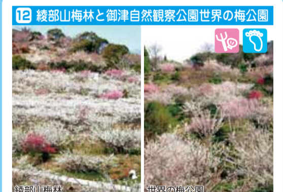
綾部山は10種2万本、世界の梅公園は350種の梅が観賞出来ます。美しい海の風景も楽しめます。春には、綾部山梅林の麓に菜の花も咲き誇ります。