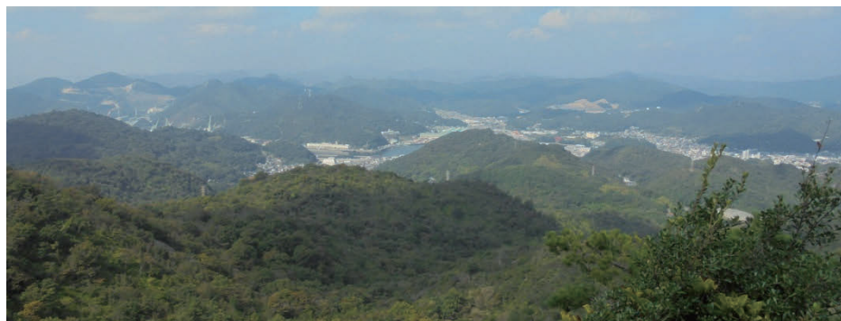
山頂から相生市を展望