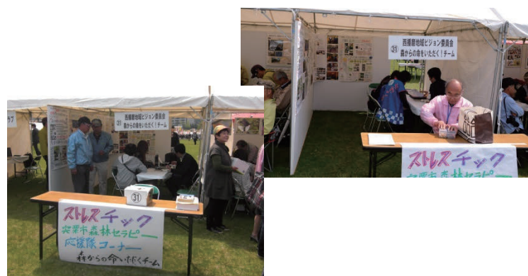
第16回 出る杭大会展示会場風景

平成28年度事業として行った、宍粟市森林セラピー応援隊養成講座を、多くの皆さんに知っていただくために、出る杭大会に出場しました。(公財)しそ森林王国観光協会の協力を得て、当日はストレスチェックを行いました。多くの方に、宍粟市森林セラピーを知っていただくことが出来、大変嬉しかったです。また、でるたん賞をいただきました。