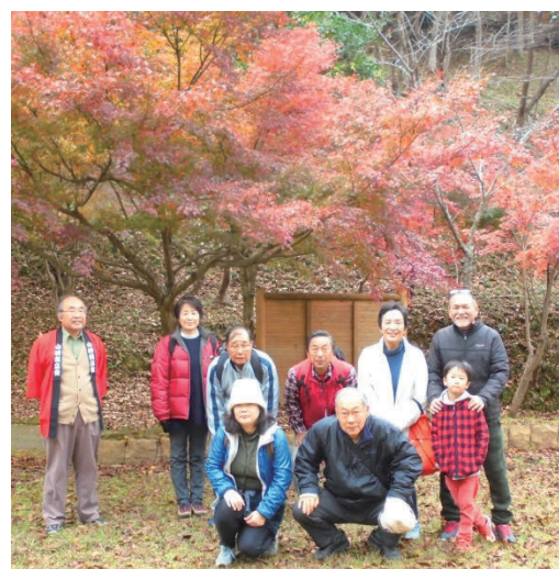
山崎町もみじ山風景

揖保川河川敷の高瀬舟出石跡→浜御殿跡(本多家城主別宅)→衣坂水子地藏尊→随陽寺→泉龍寺→恵比寿神社→埴尾神社→戦没者碑→最上山のもみじ山イベント会場→酒蔵(老松酒造・山陽盃酒造)→文化会館→本多公園(本多家本丸跡・紙屋門)→図書館→防災会館→本町通り→中央商店街→福原町→出水町という画廊展示会場鑑賞の後、昼食。もみじが大変美しく、楽しい一日となりました。