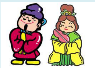
たいしくん・あすか姫