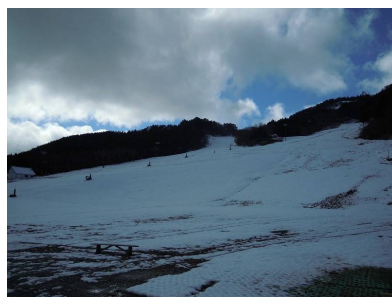
ちくさ高原はまさかの雪景色。道中の紅葉とのコラボが楽しめました。