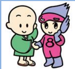
丸心くん・エイトちゃん