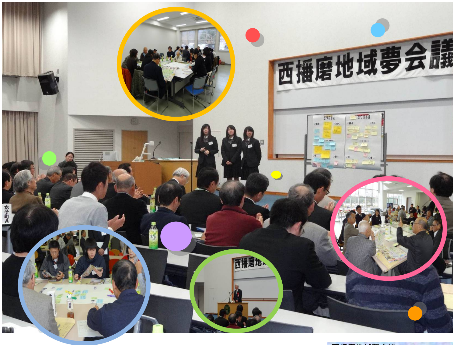
西播磨地域夢会議 (H24.12.2)