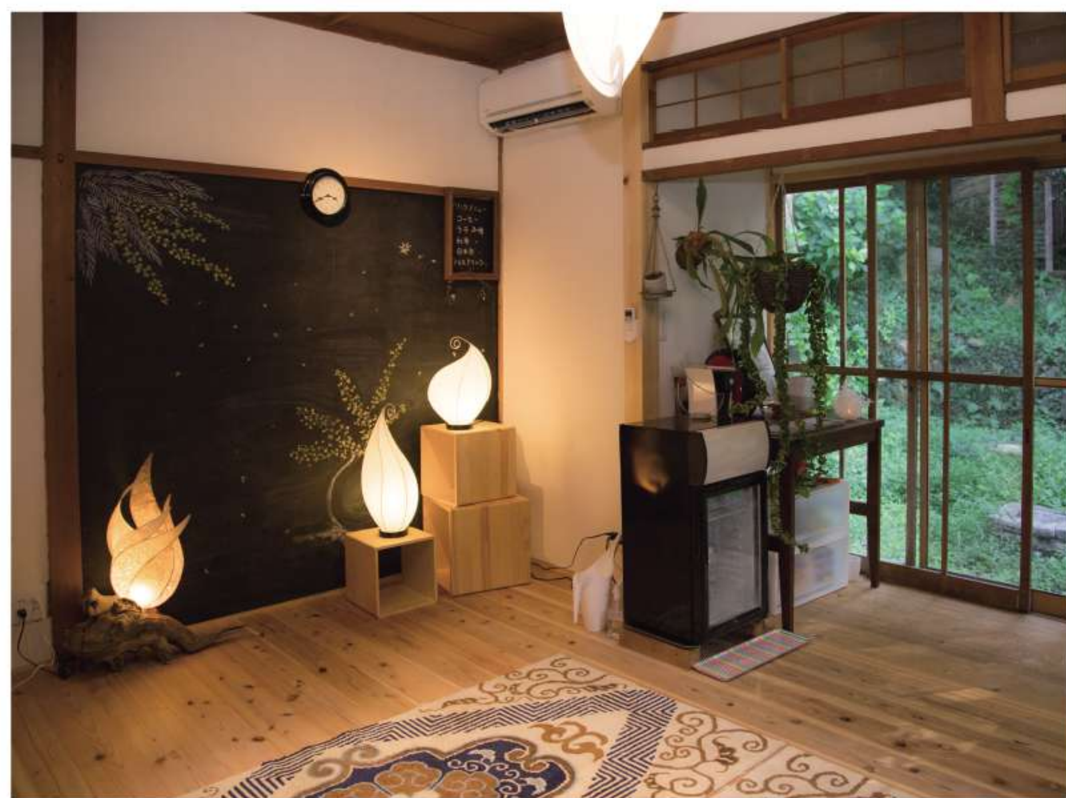
工房が入るレンタルスペース「森の家」は誰でも利用できます。

した。しかし体調を崩したり、仕事が 忙しくなったりで、作家としての活動 はぐっと減少。毎晩遅くまでハウスマ ーカーの派遣社員として働き、キャリア を重ねました。 しかし、やりがいを感じながらも心の どこかに引つ掛かるものがありました。 『やっぱり、もう一度ものづくりに戻 りたい』 年々募る思いに、退職を決意。阿波 (徳島県)や美濃(岐阜県)といった、 和紙の産地で就職活動をするなか、 久しぶりに開いた個展で転機が訪れ ます。 「それなら、仕事もアトリエもある 赤穂へ来ない？」 現況を知った知人の思いがけない誘い で、状況は一変。様々な選択肢の中ら 一番心惹かれた赤穂へ移住することに。 「再開」と名付けた個展が終わった頃 には、念願の作家活動を再開する環 境が整っていたのです。