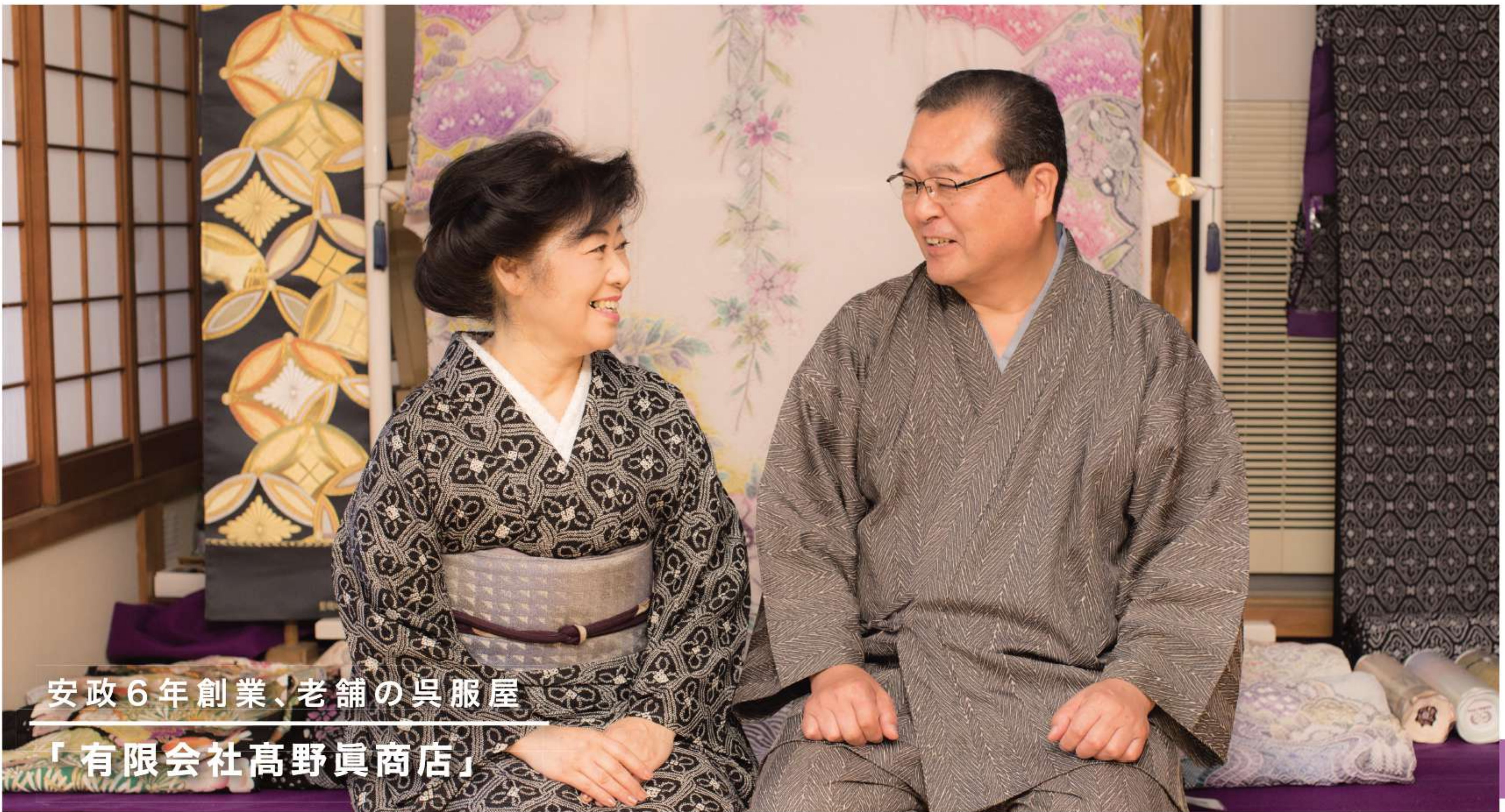
安政6年創業、老舗の呉服屋 「有限会社高野眞商店」