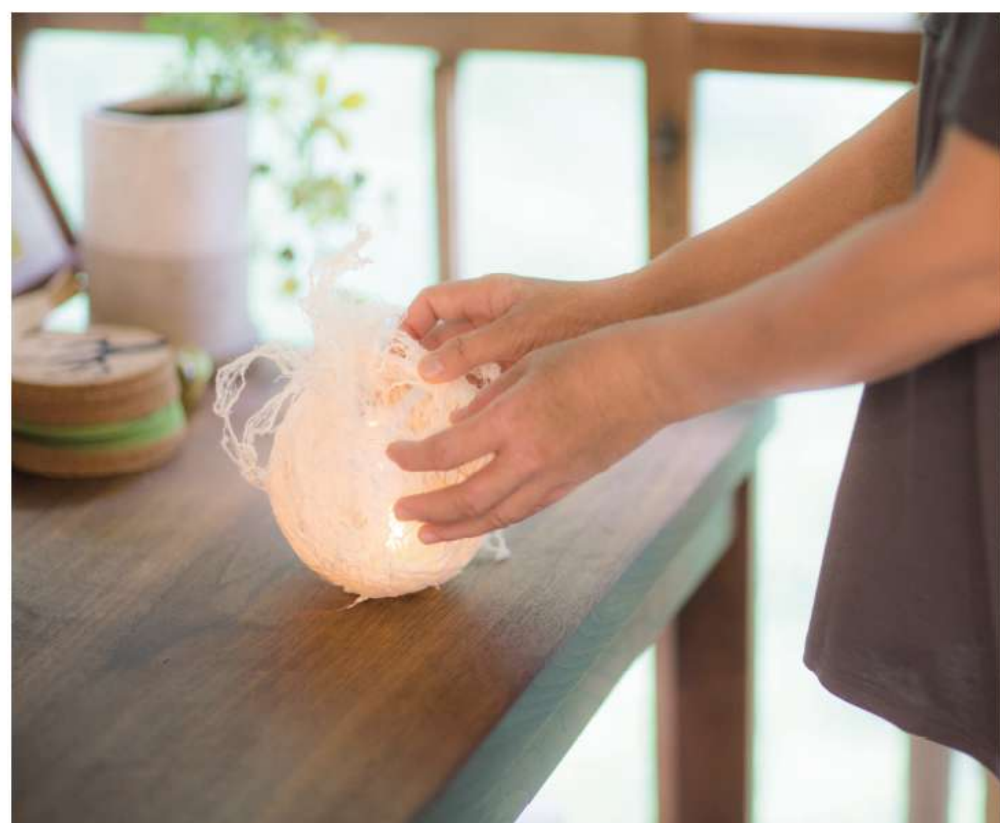
工房がある居心地のいい空間

作家活動の傍ら、アートと地域が繋がれる ような面白いスポット作りにも力を 注ぎたいと話す幸代さん。再び灯った 彼女のあかりは、見る人々に幸せをもた らしています。