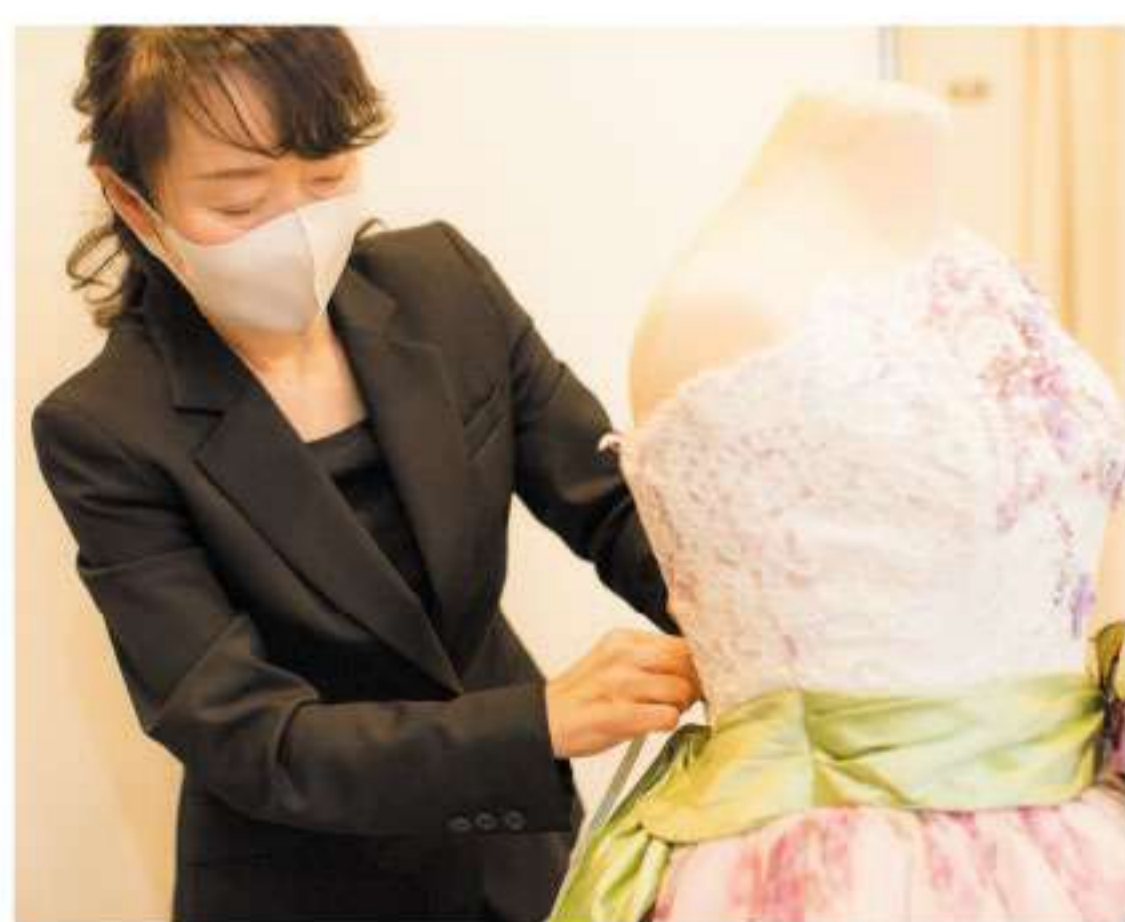
撮影用の衣装をささっと選んで下さる姿に、プロを感じました

長年地域の人々に慕われてきたお店の取組みは、家族にもスポットをあて、皆の心に忘れられない一コマを刻んでいきます。