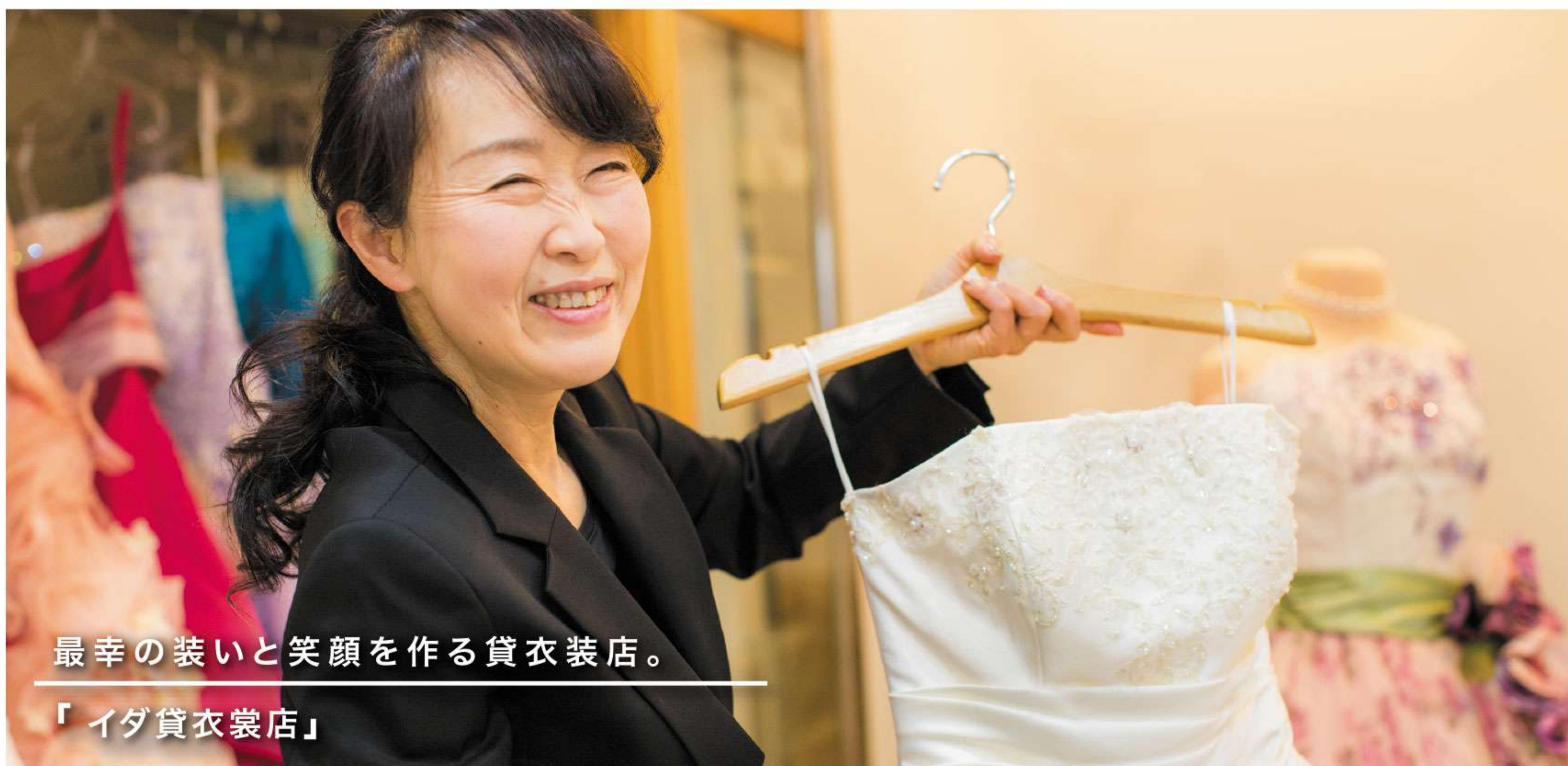
最幸の装いと笑顔を作る貸衣装店。