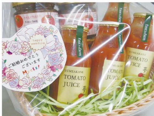
成婚した方に贈られるお祝いの品