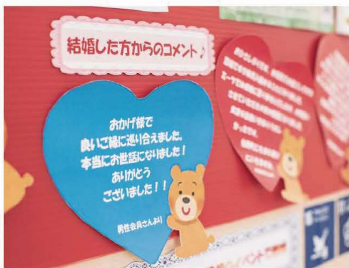
ロビーに飾られている婚活掲示板には成婚した方からの喜びの声