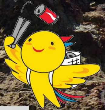
兵庫県マスコットはばタン