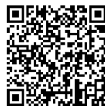
申し込みフォーム