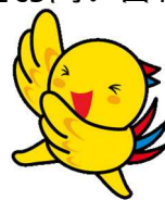
兵庫県マスコットはばタン

● 抽選はグループごとに行います。抽選結果は当落に関わらず、郵送にて代表者の方へお知らせします。