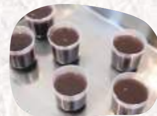
丹波大納言小豆のこしあんに寒天と砂糖を加えて作った水ようかん。ブルーベリーの上に流し入れて冷やします。

栗や小豆などの丹波地域産のおいしい食べ物を使ったお菓子が作れると聞いて「丹波の食・文化・人にふれあう 丹波大納言小豆と旬食材のお菓子作り」を体験してきました。訪れた場所は「ゆめの樹」。