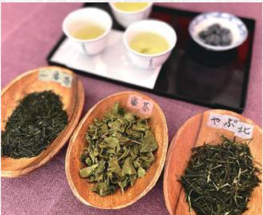
3種類のお茶を様々な淹れ方で飲み比べ。見た目も味も全く異なるのでおもしろい。

お茶の製造過程がわかったところで、日本茶インストラクターの方によるお茶の飲み比べ体験へ。少しゆるめのお湯で淹れる「一番茶（新茶）」は爽やかな香りと甘さ。「一番茶」はさっぱりとしていて後に渋みが少しやってくる感じ、「やぶ北」は甘みと渋みのバランスがよく、ほっとする味わい。それぞれの特徴を知ること、普段何気なく飲んでいたお茶の魅力を再発見できました。