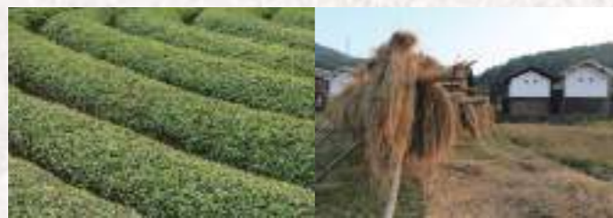
刈り込まれた茶畑