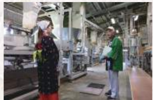
工場内部には、お茶を製造する機械がずらり。