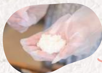
餅米はぎゅっとにぎるとお餅のような食感になり、やわらかく握ると餅米の食感をより感じられるようになります。