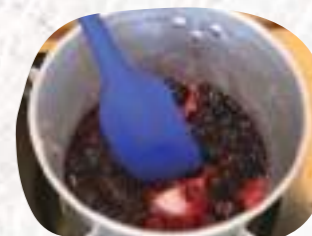
中火にして、つぶしながら混ぜていくと果汁がたっぷりと出てきます。部屋中に香りが立ち込めます。