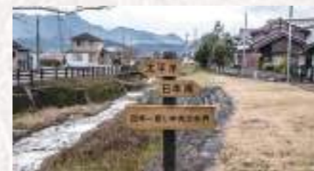
「水分け」の標識と高谷川