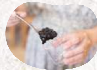
どろっとしてきたら火を止めて、スプーンでカップに入れていきます。