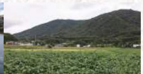
丹波焼の里の黒豆畑