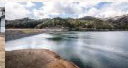
水を堪えたダム湖