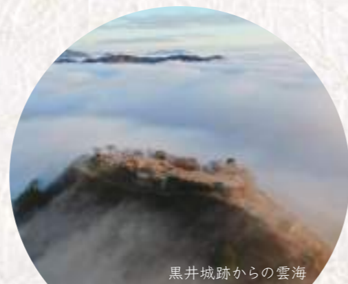
黒井城跡からの雲海