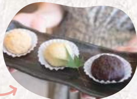
右から丹波大納言小豆、丹波栗あん、黒豆きなこぜいたくな三種類のおはぎの完成です。