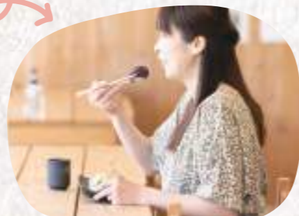
作ったお菓子はその場で食べることができます。素材の味を存分に味わうことができ、幸せな時間。