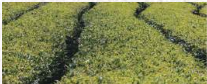
青々と茂る茶樹が立ち並ぶ茶畑は絶景。

中国から日本にお茶が伝えられ、嵯峨天皇の命によって茶樹を植える地として選ばれた5箇所の一つがこの味間エリア。当時は薬として飲まれており、朝廷に献上されるなど貴重なものだったそう。飲み物として定着したのは室町時代。江戸時代に上方（大阪）で流通するお茶の大半を占めていたと言われ、篠山藩の収入源でもあったようです。