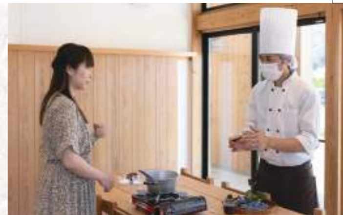
向かいにあるお菓子店「夢の里やながわ」のパティシエの方が一つ一つ丁寧に教えてくれます。(9月上旬～11月を除く)