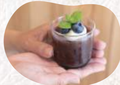
トッピングは腕の見せ所。生クリームとブルーベリー、ミントの葉を乗せて完成しました。