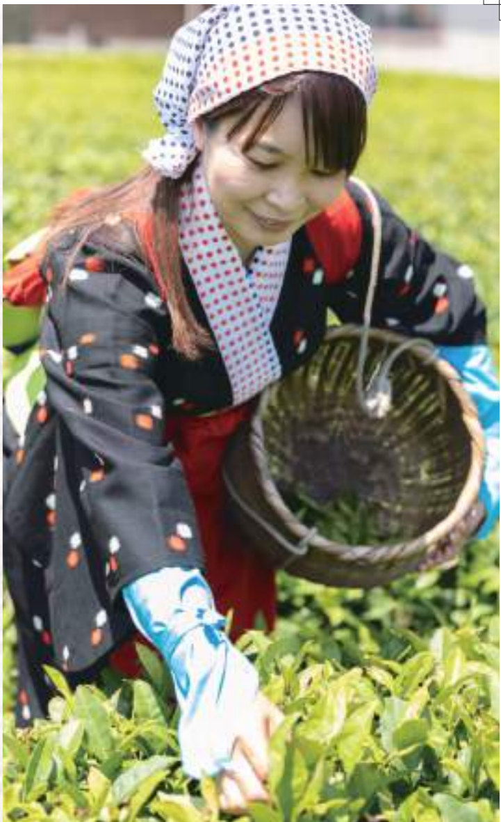
茶娘の服を着て、お茶摘み体験。摘んだ茶葉をどんどんカゴに入れていきます。