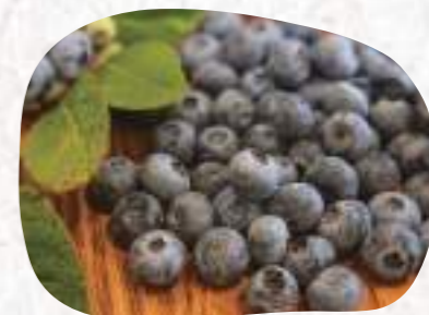
大粒のブルーベリーはみずみずしく、驚くほど濃い味わい。