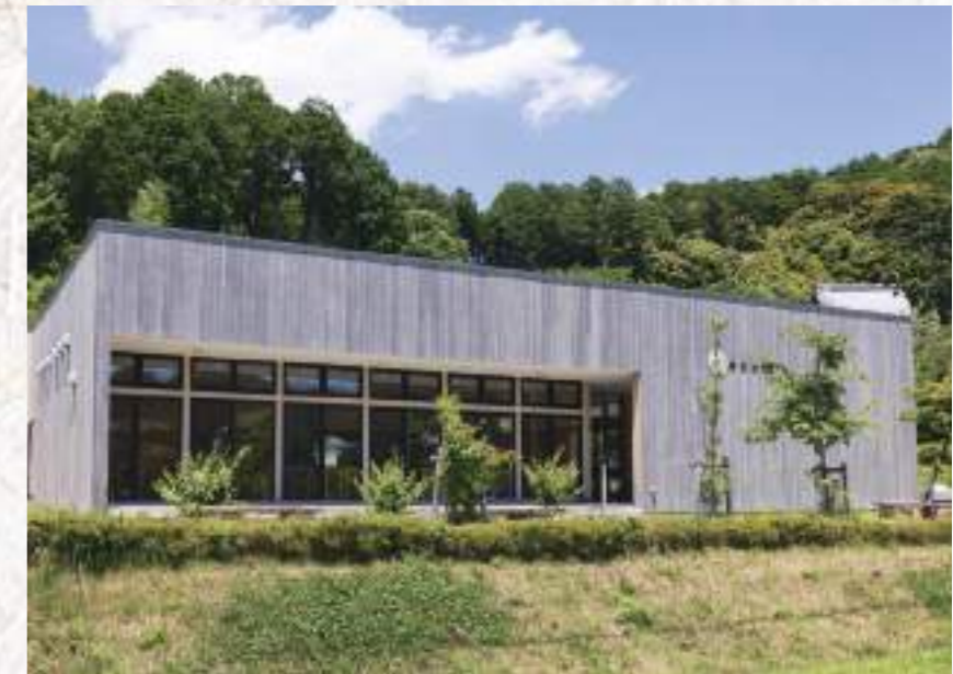
ゆめの樹は春日町にある集落の自治体が循環型まちづくりを進めるため、2015年に作られました。