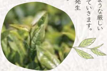
一芯二葉といって、新芽の先端部分の芯とその下の2枚の葉を摘みます。

さっそく茶娘の服を着て、お茶の世界へ出発。青々と茂る茶畑でレクチャーを受けながら茶葉を摘んでいきます。色艶もよく、みずみずしい茶葉。この茶葉たちがおいしく育つには丹波篠山の風土が関係しています。まずは寒暖差。標高200mととても高い場所にある盆地で、国内で最も気温の低いお茶の産地。年間の寒暖差だけでなく、昼夜の気温差が約10度もあります。このような厳しい環境下で茶樹は種を残そうと栄養を蓄え、大きくなっていきます。次に、春と秋に発生する丹波霧。乾燥しがちな季節に発生することもあり、茶葉に潤いを与え、余分な日光を遮ってくれます。これらの要因が、旨味と甘みに富んだ、香り高い丹波篠山茶を生み出します。茶摘みを満喫したあとは工場見学へ。お茶の香りが漂う建物の中には、摘んだ茶葉を製品にするための装置がずらりと並んでいます。