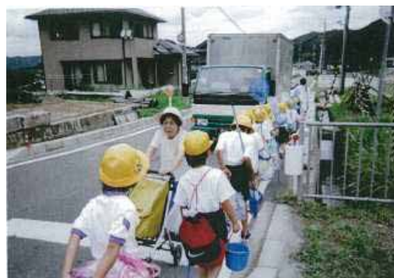
追入市島線(丹波市春日町)