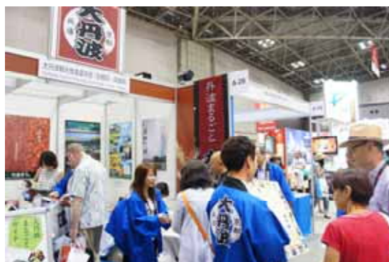
平成 25 年 9 月 12～15 日 JATA 旅博 東京ビッグサイト における「大丹波連携推進協議会」の出席

舞鶴若狭道や北近畿豊岡道などの広域ネットワークの整備が進んでいるが、観光客数はここ数年横ばい、宿泊客数は減少傾向にある。一方で、歴史的・文化的に繋がり深い隣接する京都府5市町と連携した「大丹波連携推進協議会」での地域の魅力の発信など、豊かな自然環境や食・農への関心を高めたり、防災を含めた交流を進める動きがみられる。