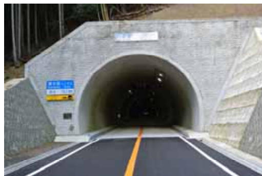
(主)丹波加美線〔清水坂トンネル〕(丹波市)