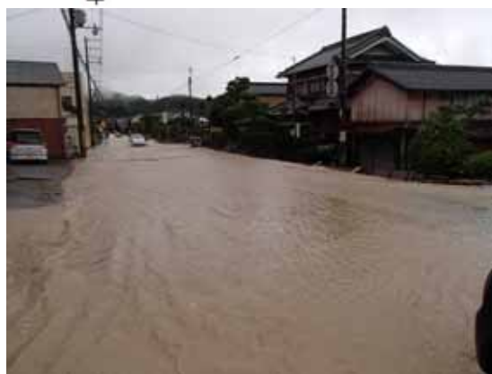
平成 25 年災害 加古川水系竹安川 (丹波市柏原町)

気候変動の影響から、1時間に50mmを超える集中豪雨が増加し、近年数度に及ぶ浸水被害が発生した。土砂流出や流木による二次被害、地震や老朽化に対する施設の脆弱性に伴う危険性も高まっている。