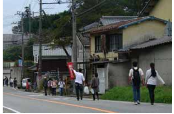
丹波焼き観光でにぎわう下立杭柏原線（篠山市今田町）

日本六古窯の丹波焼 やきものの里にふさわしい県道 下立杭柏原線 風景街道 水分れ街道 国道 175 号他 丹波の森街道 国道 176 号他 テカソ街道 国道 372 号 伝統的建造物群保存地区 篠山地区 篠山山南線他 福住地区 国道 372 号他