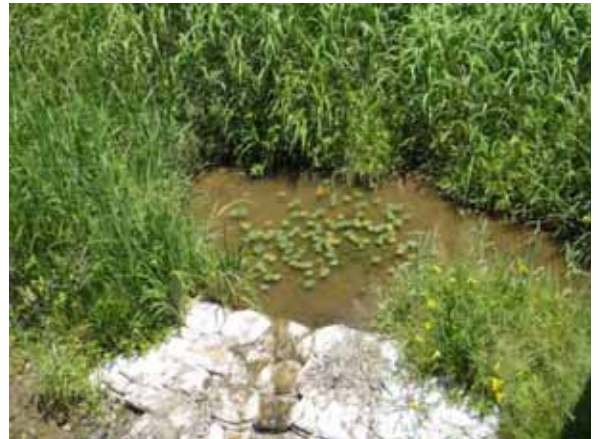
オガラウチの保全 武庫川（篠山市当野）

貴重種 オガソウカ 羽束川、篠山川 オガラウチ 武庫川 トゲハブタムシ 武庫川 恐竜化石の発掘 川代溪谷 篠山川 恐竜街道 篠山山南線