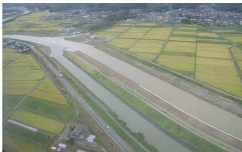
加古川・柏原川 背割堤 (丹波市氷上町)

この度、行財政構造改革の進め方を示した「第3次行革プラン(26年3月策定)」及び、今後の社会基盤整備の基本方針を示した「ひょうご社会基盤整備基本計画(26年3月策定)」のもと、地域の課題やニーズに対応する緊急かつ重要な事業を盛り込み、新たな「社会基盤整備プログラム(平成26～35年度)」を策定しました。