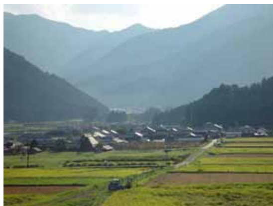
丹波らしい田園風景 (丹波市氷上町)

過疎化・高齢化が進行する中、豊かな自然と美しい景観、それらと調和した暮らしを再認識し、次世代に引き継いでいく必要がある。