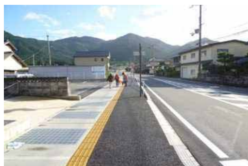
(一) 山南多可線 (丹波市)