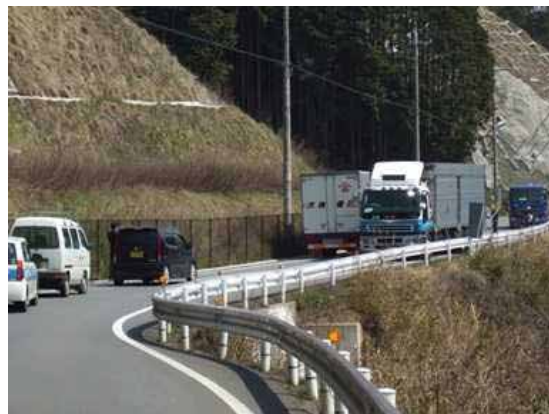
すれ違いの困難な状況 篠山山南線(篠山市大山下)