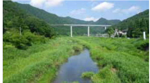
河川環境に配慮した川づくり 武庫川