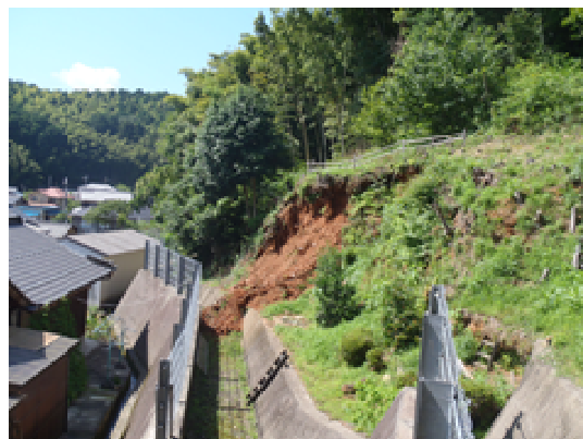
平成 24 年災害 田路地区(丹波市柏原町)

〔土石流危険溪流 全 647 箇所、整備率 23%(平成 25 年度末) 急傾斜地崩壊危険箇所 全 526 箇所、整備率 7%(平成 25 年度末) 山地災害危険地区 全 698 箇所、整備率 56%(平成 25 年度末)〕