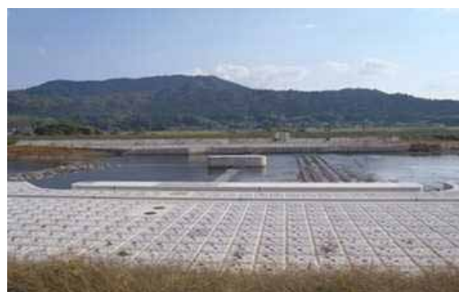
(一) 竹田川 (丹波市)