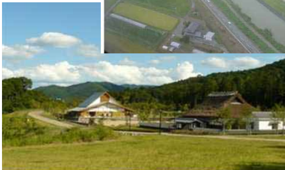
丹波並木道中央公園(篠山市西古佐)