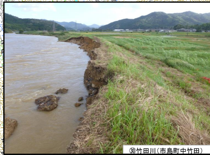
③⑩竹田川(市島町中竹田)