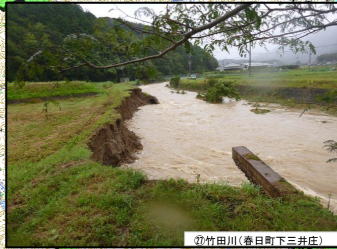
②⑦竹田川(春日町下三井庄)