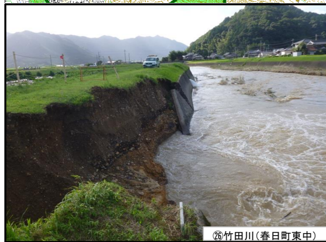
②⑥竹田川(春日町東中)