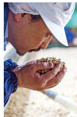
製麹は、三日かけて行う醤油造りの最も大切な工程