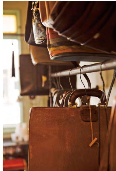
耐久性を上げる為、時間を掛けます。

百貨店に毎月出店し、品質に厳しいバイヤーとの取引の中で、技術、クオリティの向上などを図っている。「なめし革業者のまち」である姫路の技術者との提携、ラグジュアリーブランドが使用する薬剤の入手など、よりクオリティの高い仕上りを追求し続け、また、定期的に技術者を招聘し研修を行うなど、技術開発・人材教育を常に行っている。