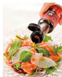
海鮮サラダなどに