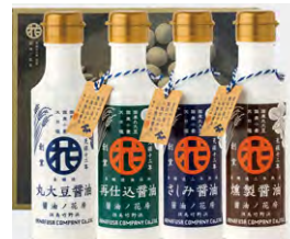
醤油ノ花房シリーズ