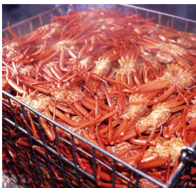
茹で上がった香住ガニ