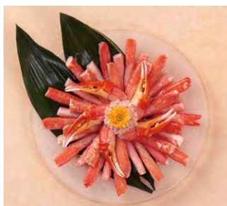
かに身商品で装飾「華」