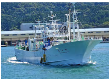
香住漁港を出港する漁船