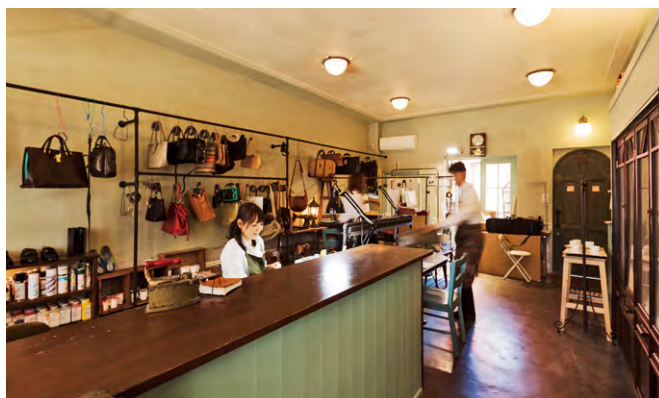
カバンクリーニング修理工房