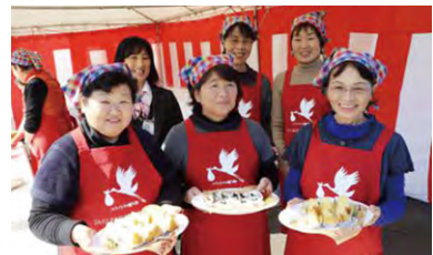
フクノハナの米粉を使用したお菓子