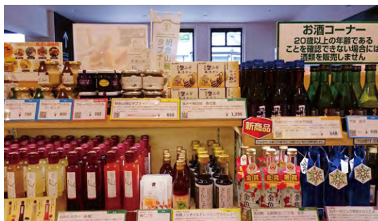
城崎温泉駅で販売されている様子