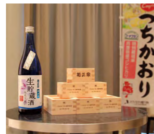
つちかおり米を使用したお酒