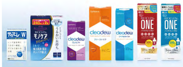
主力製品ラインナップ

また、同社は国内生産にこだわり、製品は全て豊岡工場で製造している。豊岡工場の製造人員は但馬地域での採用がほとんどであり、また、化学系の企業が限られる但馬地域において、化学系学部等の出身者がUターン就職しうる先としても有力な候補であり、雇用の面においても地域に貢献している。