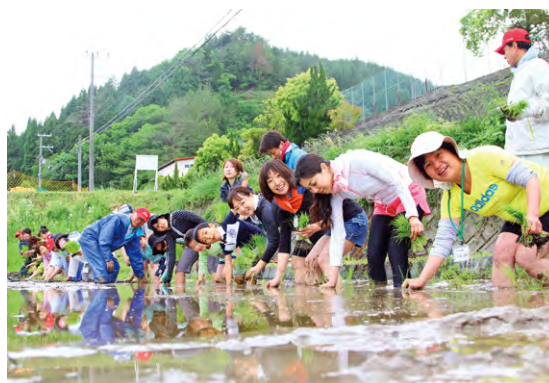
田植え交流会の様子