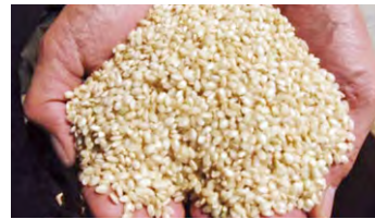
酒造好適米「フクノハナ」

契約酒造会社である(株)福光屋は、平成18年から「フクノハナ」を100%使用した「コウノトリの贈り物(純米酒)」等を販売している。最近では地元の菓子業者と連携し米粉を活用した商品開発など、特産品づくりを通じた地域貢献も果たしている。