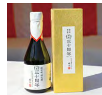
(株)福光屋が製造した 30周年記念酒