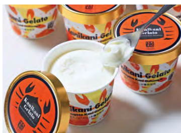
カニカニジェラート