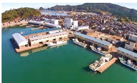
但馬漁協(香住漁港)