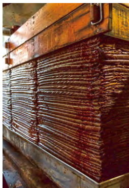
2年熟成させた醤油もろみを搾る