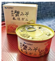
蟹みそ 無添加 香住ガニ

そのうちのひとつである「蟹みそ 無添加 香住ガニ」は、兵庫県認証食品にも選定されており、JR西日本城崎温泉駅「但馬・丹後いいものショップ」の「特産品部門」において1位を獲得するなど人気の商品となっている。他にも「かに甲羅盛り」は、これまで廃棄処分していた甲羅を洗浄選別し、その甲羅に蟹みそとカニ身を盛り、レンジ対応パックに入れ家庭で簡単に温かい甲羅盛りが食べられる商品となっている。