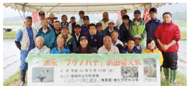
フクノハナお田植え式