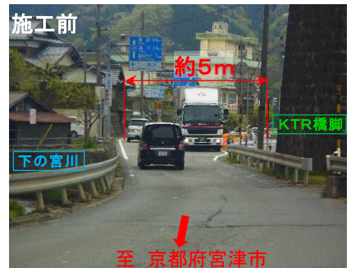
幅員が狭く離合困難な状況