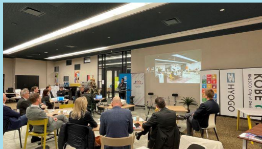
スウェーデン・マルメ市@起業プラザひょうご