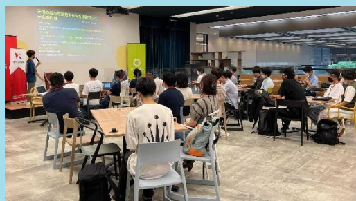
神戸大学起業部@起業プラザひょうご