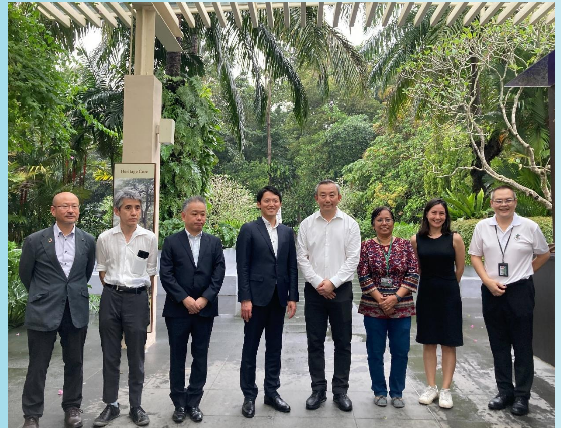
タン園長等スタッフ一同