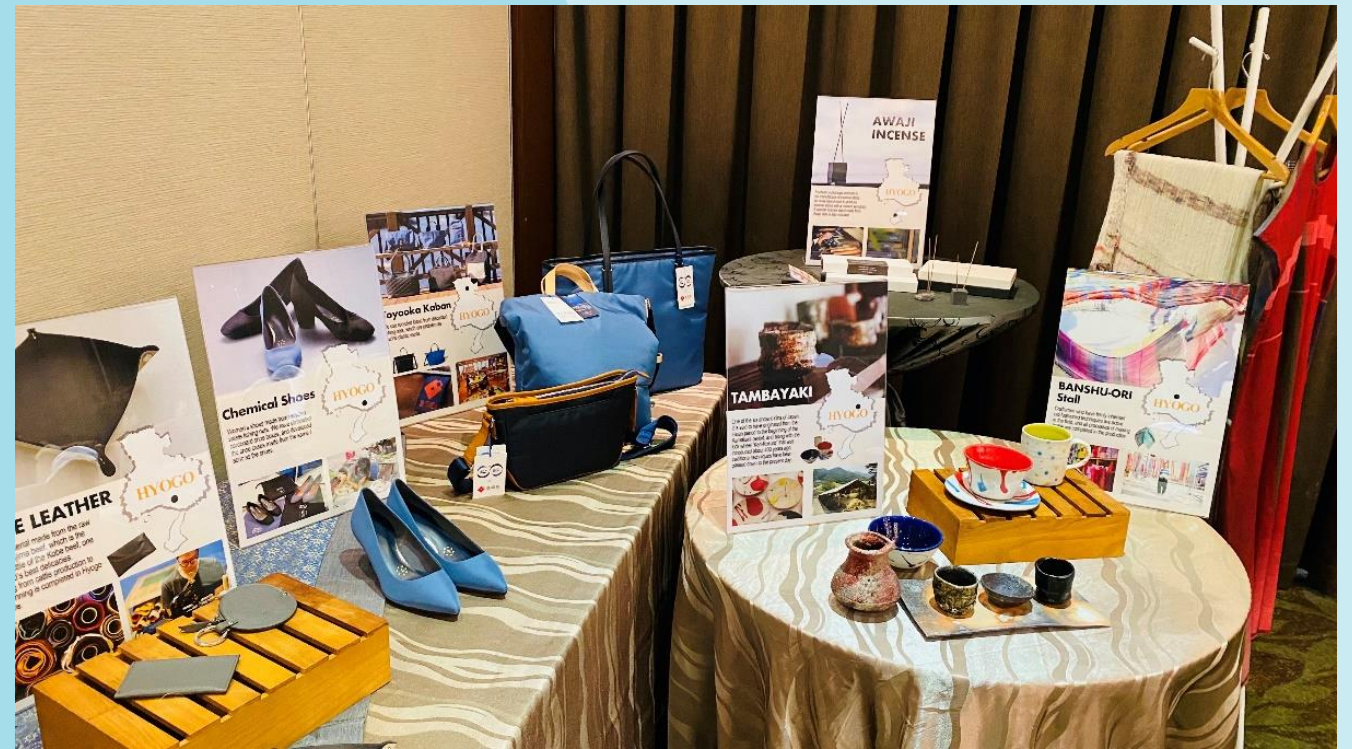
SDGsを意識した県産品のプロモーション