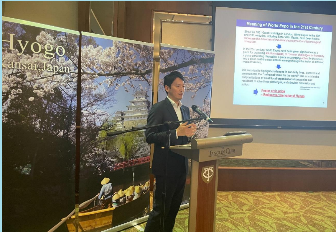
「ひょうごフィールドパビリオン」や 「高付加価値旅行者向けツアー」の紹介