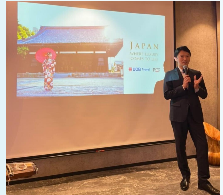
イベント参加の様子