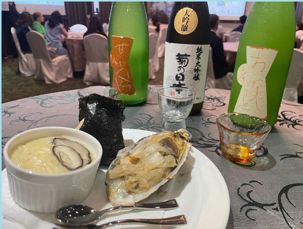
「兵庫県の日本酒と県産食材を使用した料理」の体験（試食）