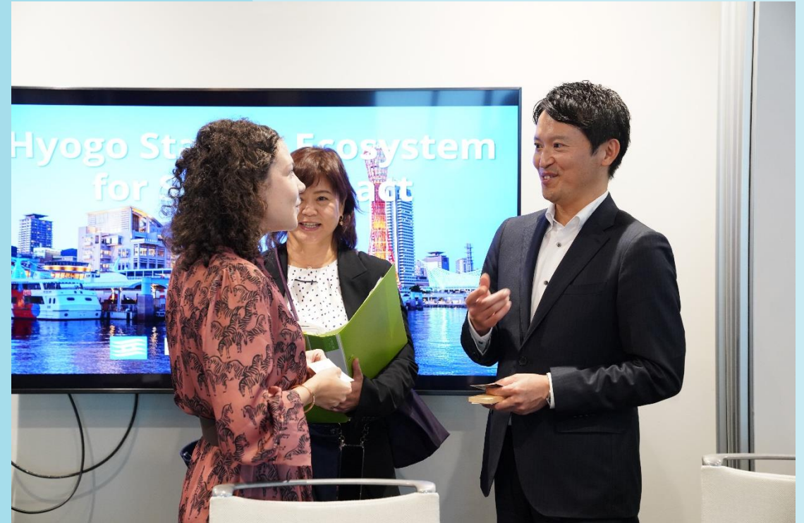
参加者（外資系ベンチャー・キャピタリスト）との歓談