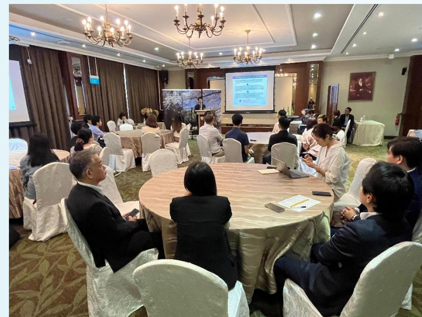
観光プロモーションの様子