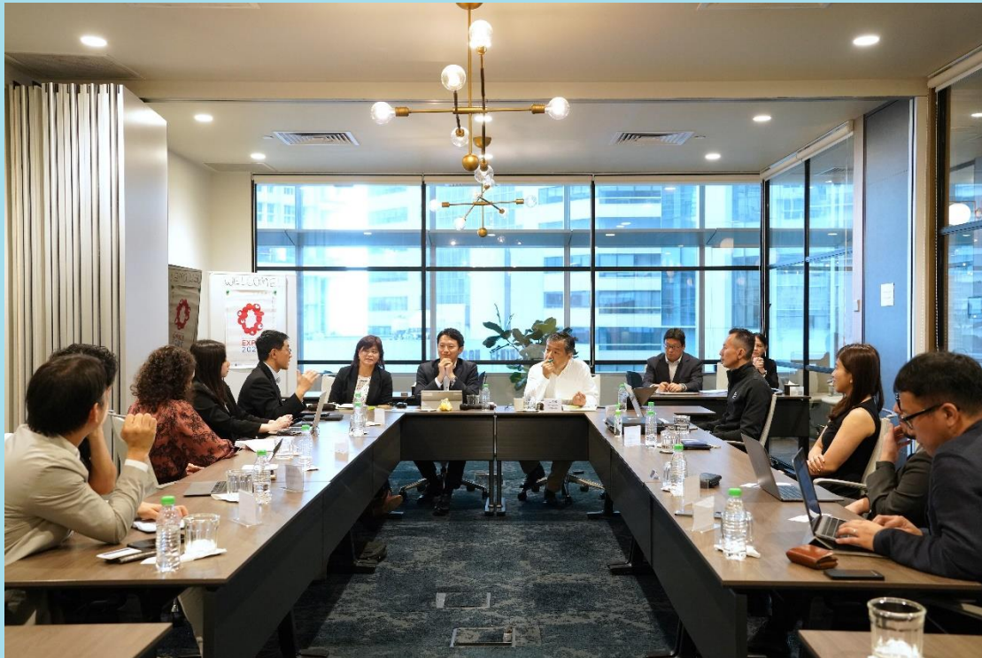
意見交換会の様子