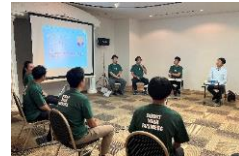
プログラムキックオフ（R5.7.21）には 兵庫県知事 齋藤元彦も参加し意見交換

アツギが、未来の会社の収益の柱となる新しいビジネスの種を撒くプログラムとして、 五穀豊穡のごとく、ひょうご五国の未来に新しい実りをもたらす アツギの挑戦を応援