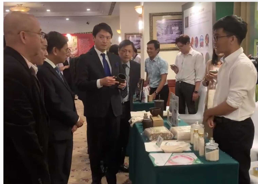
会議・グリーン企業の展示会での様子