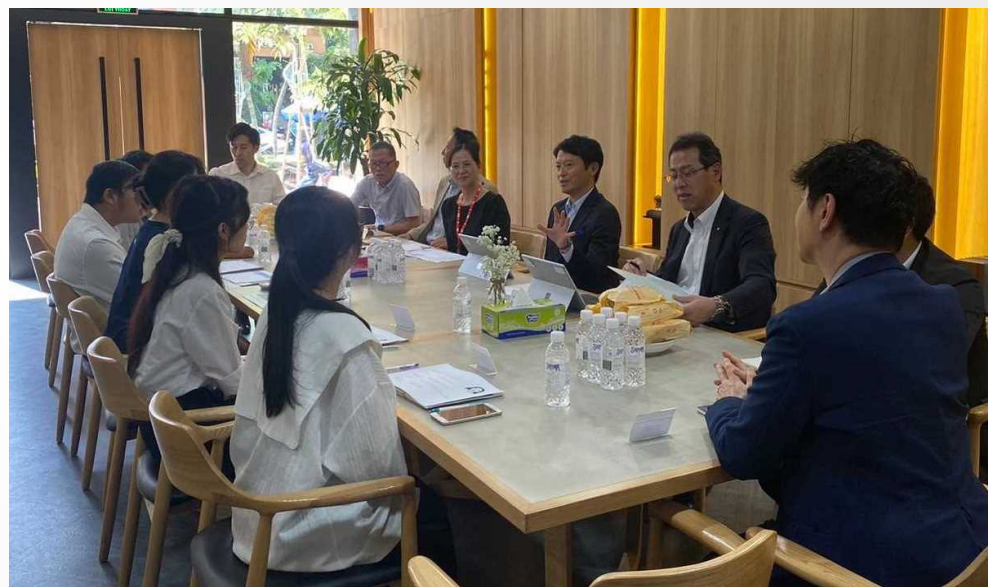
学生との意見交換の様子