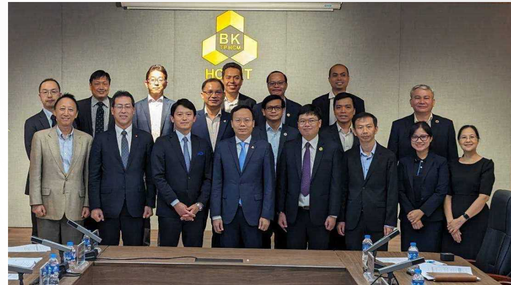
大学関係者、現地日系企業関係者と共に