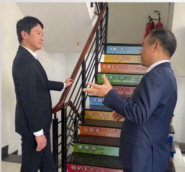
ロンソン社長との意見交換