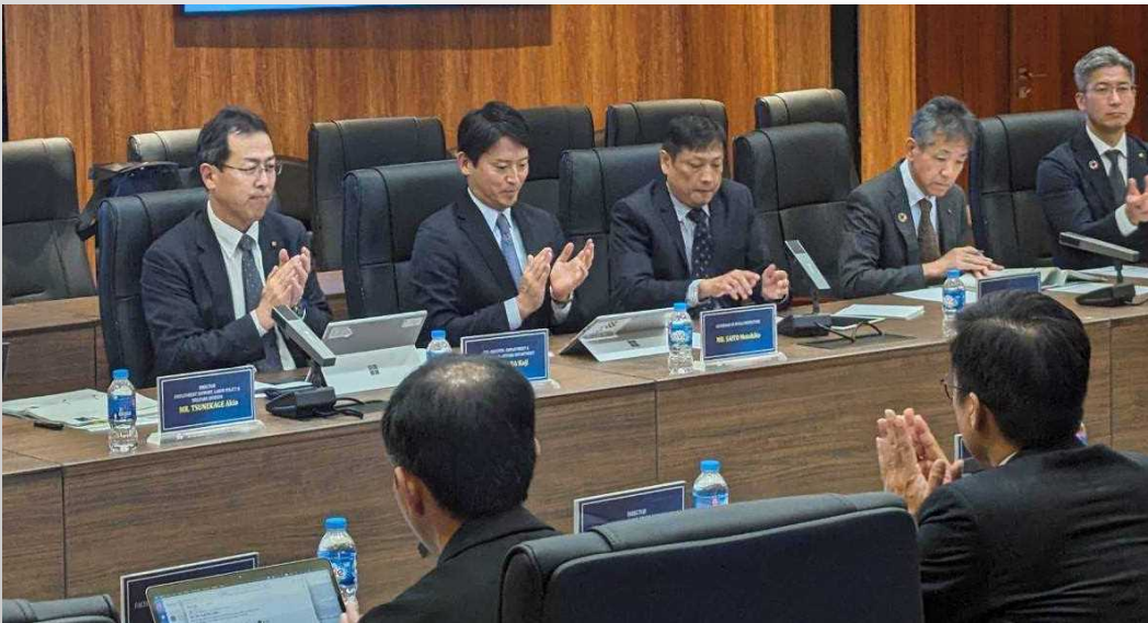
フォン学長との意見交換