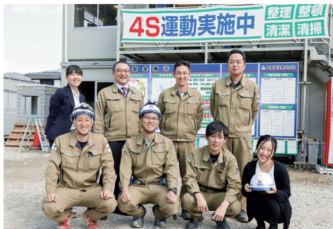
“街と人”がかかわるあらゆる空間を創造します

わたるビジネスモデルを展開。そのビジネスモデルが評価され、2019年には、有名雑誌での企業生き残りランキングでも全国1100社の中、8位を獲得しております。社員一同「誠実は信用の源」を合言葉に、日々成長しています。