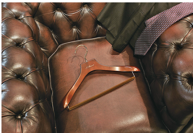
海外でも人気の代表的なハンガー

ものづくりに反映したり、ウェブサイトやショールームを通じて新たな価値を発信することで多様なニーズを創造しています。近年は海外からの問い合わせや注文も増えており、世界一のハンガーブランドになることを目標に活動中。服(福)をかけるハンガーとして、お客様に感動していただけるものづくりを心掛けています。