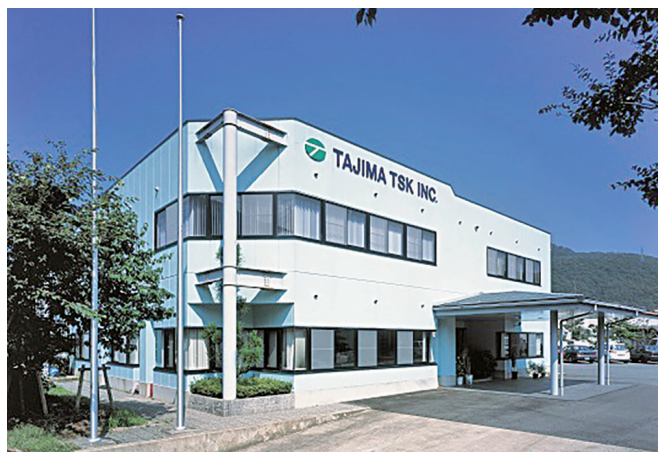
但馬ティエスケイ株式会社

■冷間鍛造に関する受賞・認定 顧客より原価改善感謝状、但馬産業大賞受賞、 ひょうごオンリーワン企業認定