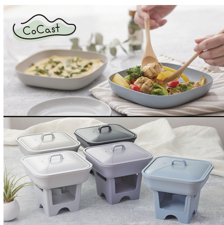
アルミ製品で温かい幸せをお届けします

合って良い製品づくりに取り組んでいます。品質と環境のISOを取得し、SDGsにも配慮した生産活動で、「妥協を許さない品質力」と「進化し続ける技術力」を磨き、暖かい幸せを提供しています。