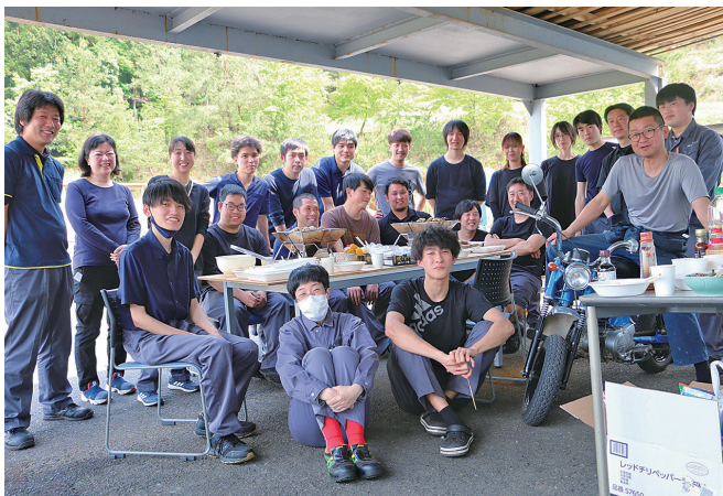
若さあふれる会社です

毎年新卒社員定期採用があり、中途社員も増えている成長中の会社です。モノづくりを通し、「ヒトが成長する企業づくり」を進めています。