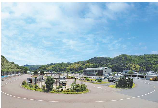
自然に囲まれたひろびろとした教習コース

普通・準中型・中型・大型・普通二輪・大型二輪・大型特殊・けん引・普通二種の運転免許取得のほか、高齢者講習・初心運転者講習・取得時講習・原付講習・ペーパードライバー講習・企業運転講習等の各種講習を行っています。