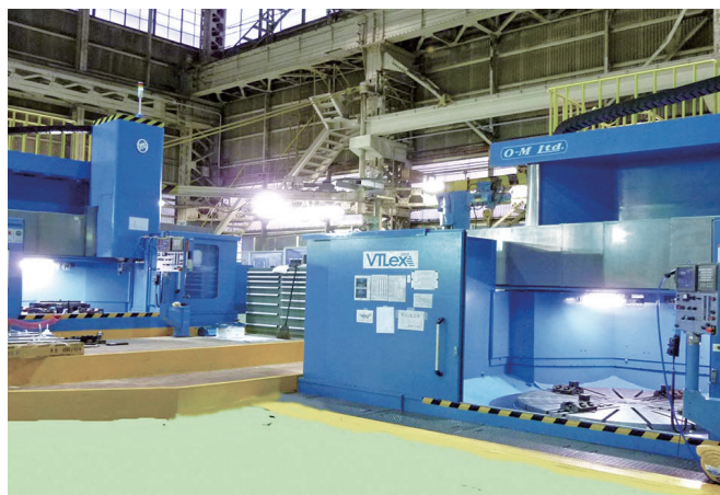
巨大工場の運用・保守・管理全般をサポートします

エンジニアリングと技能で、それぞれの現場の条件について細かく考察しながらビジネスのさらなる発展と業務効率化を目指した最適なソリューションを提案し、ワンストップでお客様の工場運営を力強くサポートします。