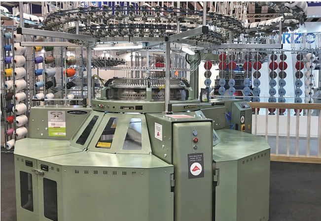
弊社の丸編み機です（海外展示会の出展機種）

近年ではニット製品が増えており、今後も丸編み機の需要は拡大し、躍進していくことでしょう。