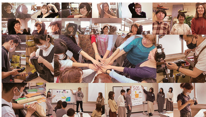
組織力・チーム力でオンリーワンの魅力を創り続けています

お客様の喜びのために、常にテーマを「自信と成長」に置いています。自分の役割・存在価値を上げるためにオンリーワンのデザイン、オンリーワンの仕組みづくりを。自由なアイデアを集結し形にし、私たちは未来を変えていく企業であり続けます。