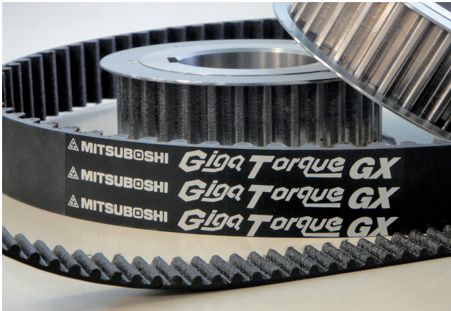
世界最高水準の伝動ベルト ギガトルクGX