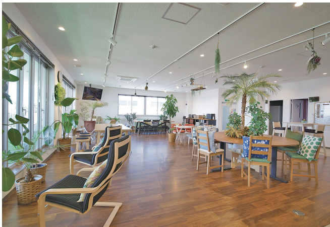
バイオフィリアを取り入れたフリースペース

たにコーポレートスローガン「Enjoy the Change!」を掲げ、変わりゆく時代や経済、 環境の変化を予測しつつ、変化を怖れず適応 し、自らの変化、より良いモノづくりの変化、 そしてお客様とも一緒に変化し続け、これか ら社会そして環境に貢献していきたいと考 えております。