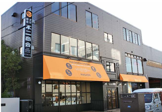
手前がキッチン工房と事務所、奥が工場

デュース。そのお店でしか販売できないオンリーワンバウムクーヘンのレシピ開発から、繁盛する店舗設計・売り方提案、バウムクーヘン製造の技術指導まで一から丁寧にしています。製菓の経験がない農家や建築業者といった事業者の創業支援実績も豊富で、高く評価されています。