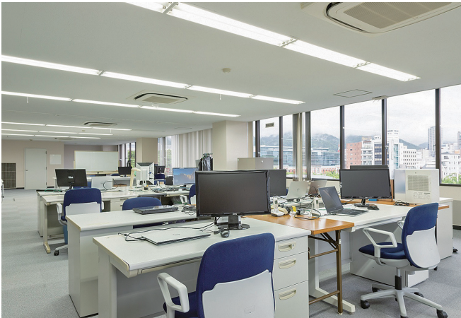
JR神戸駅から徒歩5分のオフィスです

また、PCで利用するソフトウェアだけでなく工場の生産ラインの制御設計や、組み込みシステムと呼ばれる機械を動かすためのプログラムなども手掛けています。