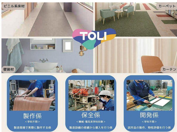
カーペットや壁紙、カーテンなどの内装材メーカー

オフィスにも、大型ショッピングセンターにも、空港にも、そしてみなさんの学校にも…。普段何気なく過ごしている空間に東リの製品はあふれています。