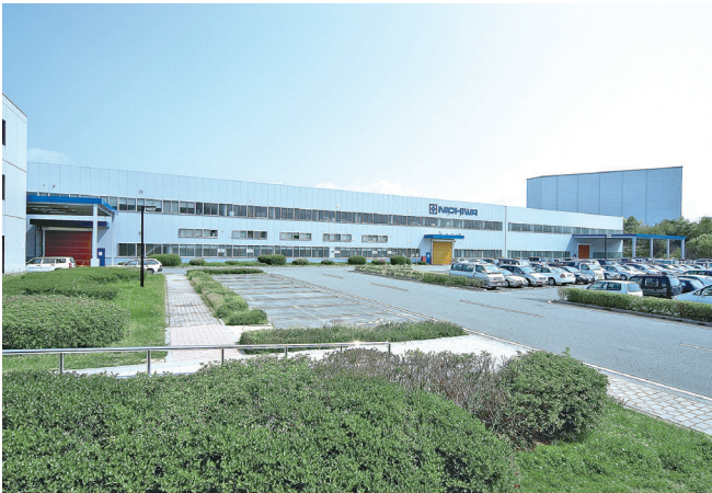
兵庫本社および本社工場の外観

製品のデザイン・寸法から小さなパーツに至るまで、全て自社で設計開発しています。こうしたこだわりがお客様に評価され、業務用電気厨房機器ブランドにおいて、トップクラスのシェアを誇るまでになりました。