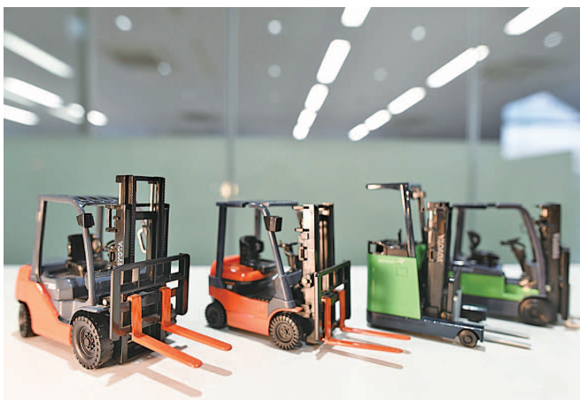
お客様の物流の未来をともに創る

一人ひとりが持つ最大の力を発揮できる、企業の環境・風土づくりも大きな使命と考え推進しております。私たちはお客様に喜んでいただくことが当社の発展にもつながるといえる考え方のもと、日々活動しております。