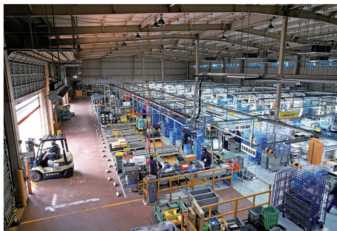
大手自動車メーカー（ダイハツ工業株式会社）の純正部品を取り扱う仕事です

NASUグループは、これからもみなさまから必要とされ、いつも「ヒト」が真ん中にある会社として進化を続けてまいります。