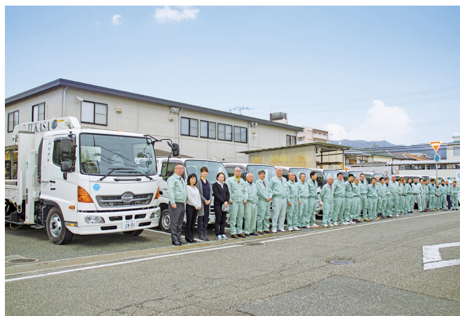
関連会社を含め総勢29名で日々活動中です

に力を合わせ24時間体制で仕事をしていません。土木技術者は営業を兼任し、プランニング・設計・施工管理まで行っており、職人は大工・左官・鍛冶工・ こ 重機オペレーター等幅広く活躍しております。