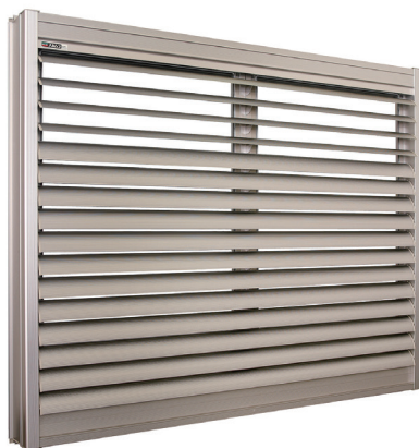
全国のマンションに取り付けられている当社製品

「Try to Challenge」をスローガンに新しい事業領域に挑戦していきます。