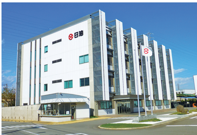
工場と研究所（2011年竣工）が隣接

事業では、シャンプーや化粧品等のライフ・ヘルスケア分野や電子・情報関連分野、環境・エネルギー分野に製品を展開しています。ライフサイエンス事業では、医薬品を体内の必要な場所へ必要な量を必要な時間だけ作用させ、効果を最大限に高める技術、DDS（ドラッグ・デリバリー・システム）関連の製品を展開しています。