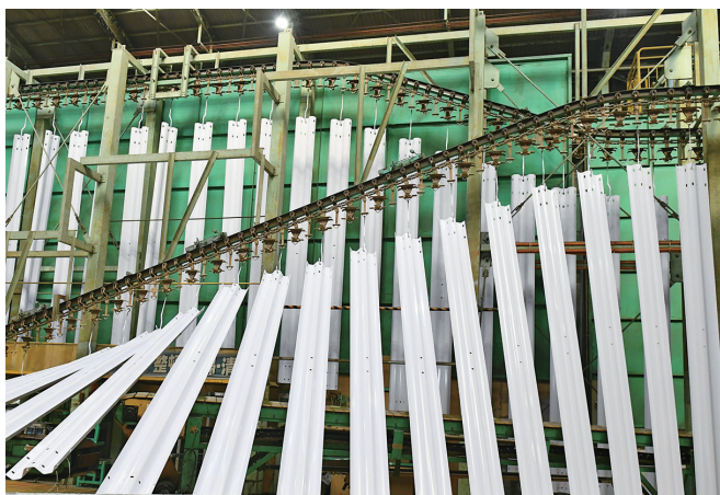
尼崎製造所 ガードレール塗装ライン

これからも、未来に向かって、高品質・高性能で最良・最適な製品づくりに取り組んでいきます。