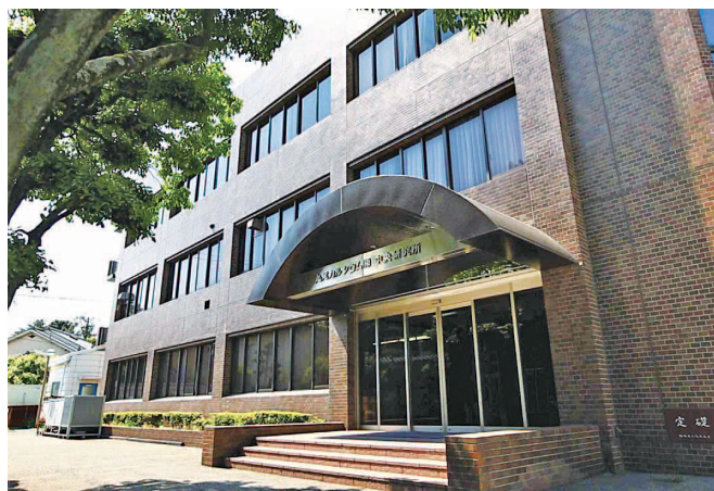
炭酸カルシウムの総合研究拠点「中央研究所」

石灰石を原料とする炭酸カルシウムは安全で環境にやさしく、今後さらなる用途の広がりが期待できる素材です。あらゆる可能性を秘めた炭酸カルシウムという素材の機能を最大限に引き出し、人と社会に豊かさと快適さを提供し続けていきたいと考えています。