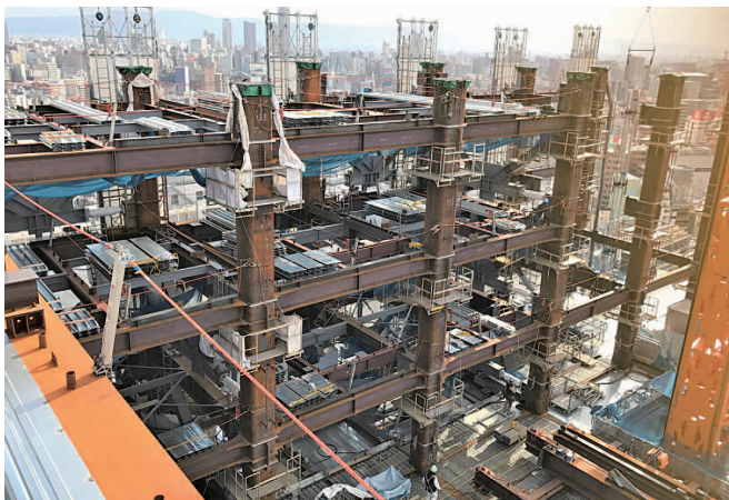
あなたの街のあちこちで、いい仕事しています

創業から47年、身の丈経営を信条とし、ゆっくりと、しかし着実に業績を伸ばし、規模を広げてきました。独自のブランド力を持ち、地域や社会、世の中の屋台骨を支える企業をめざしています。