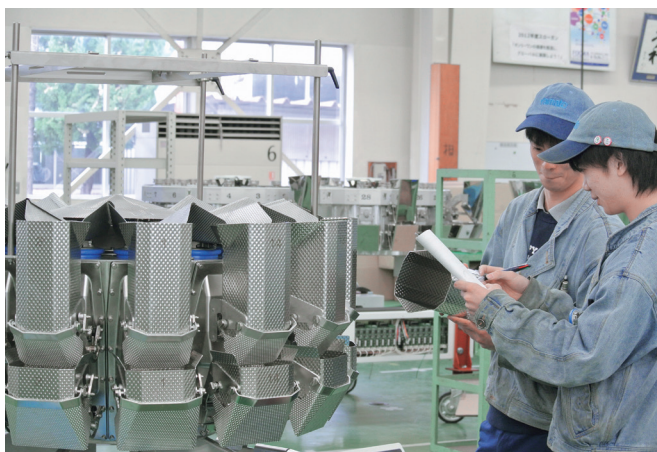
製造職として多くの若手社員が活躍しています！

“はかり”がなければ何も作れない。当社は、これまでも、これからも“はかり”を通して、世の中の単位を守るという公的な責務を全うします！