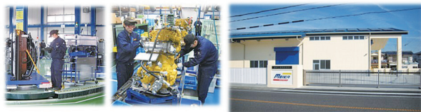
第1・第2工場と組立ライン風景