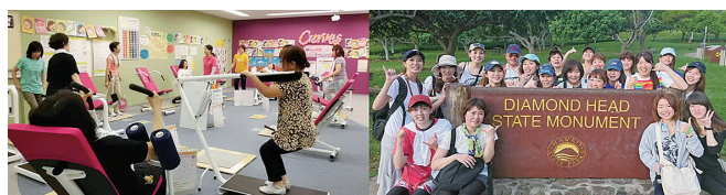
サーキット・トレーニング

これから40店舗、50店舗と地域に元気の輪を広げ、みんなから「いい会社」と言っていただけるモリススマイルへ、大きく成長していきます。