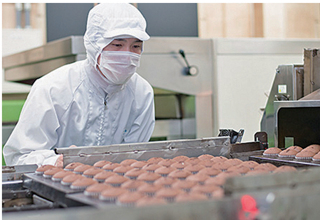
製造で頑張っている社員

また、お客様だけでなく、納入業者様に丸中と取引して良かったと思ってもらう。従業員様に、丸中で働いて良かったと思ってもらう。そう思われ続ける様に“感謝の気持ち”を忘れずにお菓子を作り続けます。