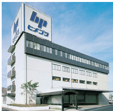
本社は姫路駅から徒歩約10分のところにあります

2008年には「NET販売事業」に進出し、ヒメプラならではの多彩な品ぞろえと、豊富な経験、機動力でお客さまからのダイレクトなご要望やこだわりにも対応。多くのお客さまにご好評いただいております。