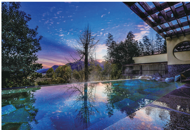
旅館の伝統を継承しながら、時代に合わせたサービスを

現在は西播磨に5つの旅館を運営しており、開業当初からのおもてなしを継承しながら地域の特性に合わせた旅館づくりを心掛けています。近年はお客様のニーズも多様化しており、それに応えるため一部客室をコンセプトルームに改装しお客様により良い体験をしていただけるよう日々進化し続けています。