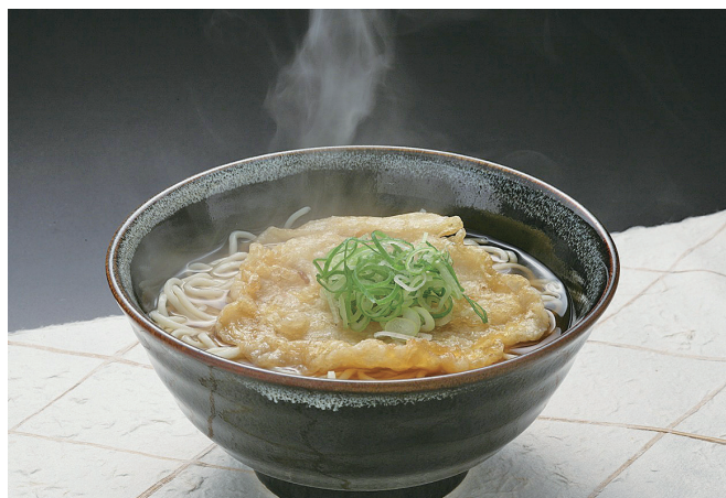
まねきのえきそば

また、コロナ禍においては、同業他社とコラボした駅弁を開発して話題になり、多くの方々に喜んでいただいています。