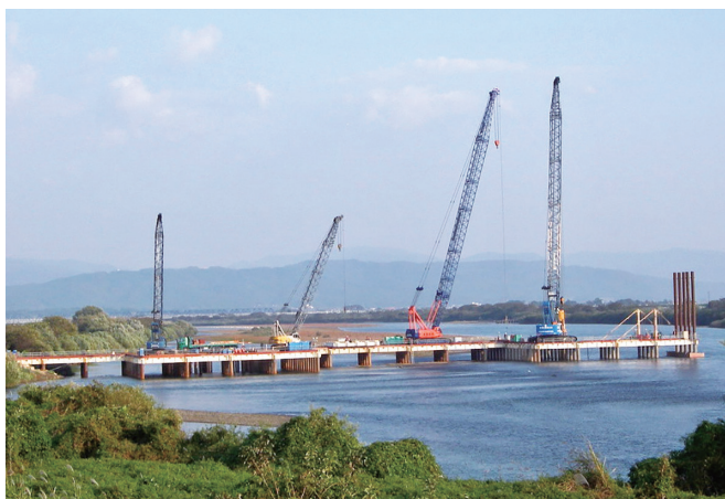
作業用構台架設 (リーブラ工法)