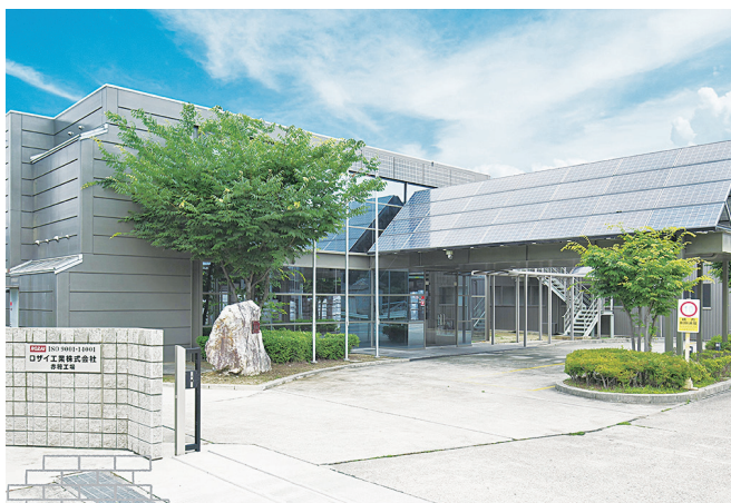
創業60年を超える耐火物製造工場です

また、従業員のスキル向上を目的とした資格取得支援制度を設けるなど、ワークライフバランスを重視した働き方にも取り組んでいます。