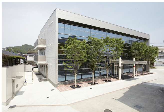
本部事務所 平成23年11月竣工

全量を弊組合の専用倉庫24棟に入庫、弊組合責任で製品管理をしています。これを消費シーズンに出荷、全国の特約店を通じ、消費者のお手元へお届けする販売システムをとっております。近年ではそうめん文化を海外に発信するために展示会に出展し、手延べそうめん『揖保乃糸』を世界に広めています。