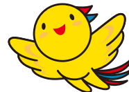
兵庫県マスコットはぼたん

兵庫県内で正社員として働きたい方を対象に 兵庫県内で正社員採用をしている企業とのマッチングを促進するプログラムです。 経験者を求める求人から未経験で応募できる求人等、様々な業種・職種の求人と出会えるチャンスです。 新たな仕事にチャレンジしたい方の参加をお待ちしております。