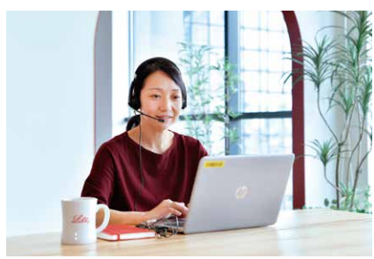
カフェテリアなどリラックスできる空間でミーティングをすることも多いそう。

例えば、子どもがまだ小さい頃に大けがをした際、高度な医療を提供する県立こども病院の存在が心強かったこと。中学受験を控える中、交通の便が良いため選択肢は関西全域まで広がり、それぞれの個性に合った学校選びができること。自宅から車で1時間ほどの距離に大自然が広がっていて、キャンプにスキーにと年中さまざまなアウトドアを楽しめること。「兵庫に住んで良かった」という事例は数え切れず、今の暮らしに大いに満足しているようです。