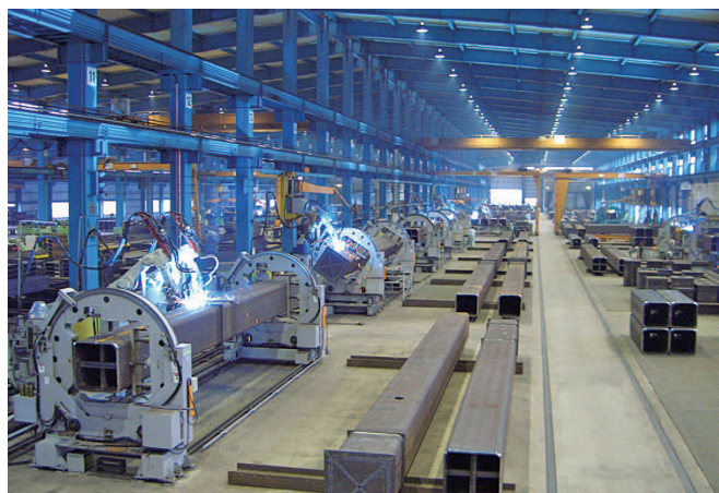
最新の技術力で短納期・高精度を実現

私たちは、100年企業を目指し、品質の向上と人材の確保・育成に注力しています。建築物の根底を支える『ものづくり』を通して、私たちと一緒に未来に残る建物を創っていきませんか？