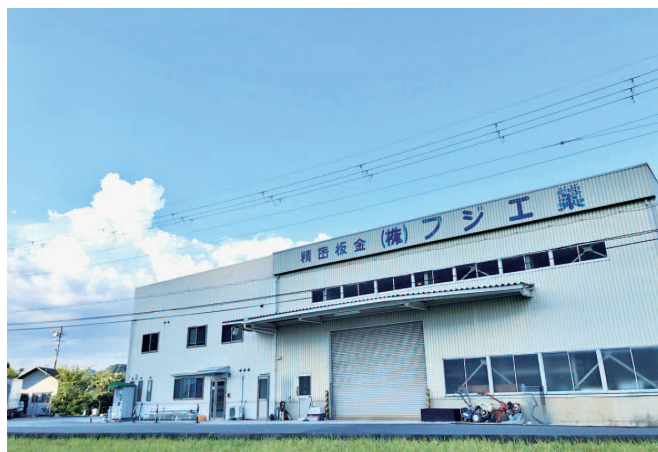
2021年に創立40周年を迎えたフジ工業（外観）

も必要な車やテレビ、スマートフォンなどに使われる半導体を製造する装置などのシャーシや部品を、私たちはお客様と一緒に“どうしたら形にできるか”、“どうしたら安定して生産できるか”を考え、なくてはならない部品を作り、お客様の製品を通して、社会に貢献しています。