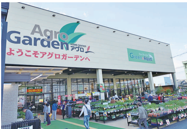
西播地域を中心に地域密着の店舗を展開

店舗で売場担当として販売や商品管理の経験を積んで店舗運営をする副店長・店長職、専門的な商品知識・販売技術を習得して、お客様に満足いただける商品の仕入れ・調達・販売方法を提案するパイヤー職へのキャリアアップもしていただけます。地元企業で自分らしく長くお仕事をしておられる場所をご用意しております♪