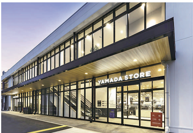
私たちは食品を通して地域の未来を支えます！

の不足と需要の増大に伴い、地域社会の持続性、または回復力を築くことができる、食料システムの新しい地域モデルを創出していくため、当社では小規模生産者とともに地域の活性化を促していきます。一緒に地域の未来を創造してみませんか？