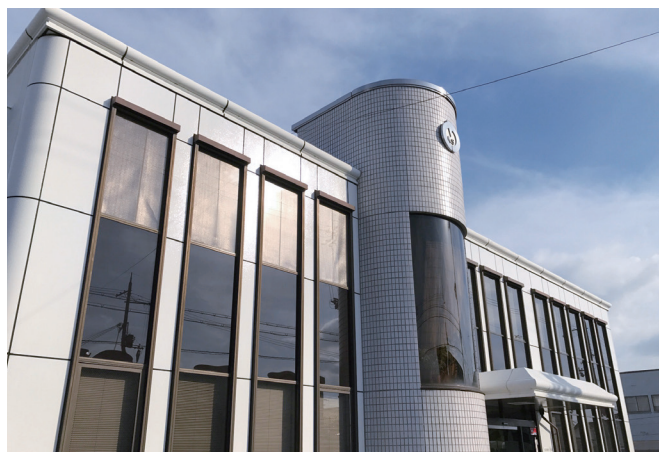
創業132年 さらに歴史を積み重ねます

これからも目指す姿「創造性豊かなサービスをもってお客様に満足をお届けする企業」に向けて社員一丸となって取り組んでいきます。