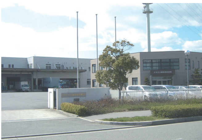
加古川東工業団地内 本社工場

さらに、もうひとつの基幹事業としてワイヤハーネスを中心とする電装事業があります。ワイヤハーネスとは複数の電線を束ねてコネクタをとりつけた製品の総称ですが、様々な電気製品の内部で電気供給や信号のやり取りを可能にする大切な部品です。海外と国内に生産拠点を設け、お客様の需要にお応えしています。