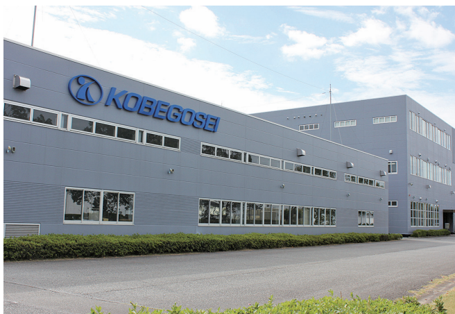
小野市でお客様に喜ばれる製品を作っています

一番の目標は使っているお客様の安全を守りながら車やバイクを綺麗にし、お客様にも社員にも笑顔になってもらうことです。