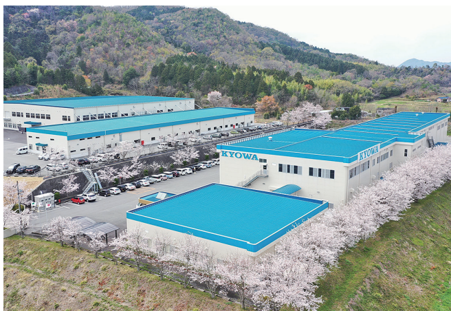
産業機器事業部 窪田工場（第1・第2・第3工場）