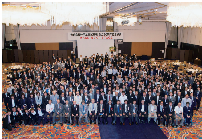
ともに明日を切り拓く仲間をお待ちしています

創立74年を迎えましたが、今後100年続くグローバル企業を目指し、挑戦を続けていきます。当社の「これから」を一緒につくっていきましょう！