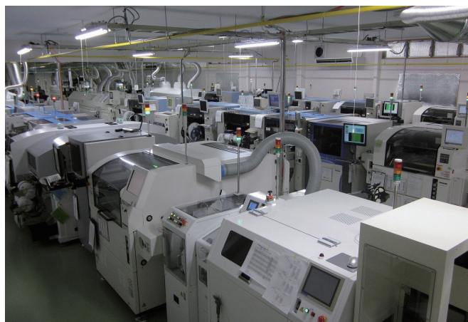
工場内 電子部品実装ライン

また、自社製品の開発にも力を注ぎ、停電しても消えないLED電球「レス球」は国内外で注目を集めています。