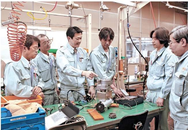
商品開発は、皆で試作品を評価

機械産業など基幹産業をはじめ、あらゆる「ものづくり」現場の発展を支えるとともに、世界の生産プラントや製造設備でその信頼性を実証し続けています。