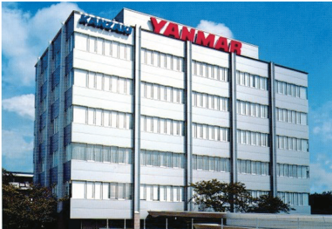
JR猪名寺駅から徒歩5分の場所にある本社ビル

基本的に尼崎本社での勤務となるため、兵庫県で働き続けたい方や生まれ育った土地に恩返しをしたい方にはぴったりの会社です。