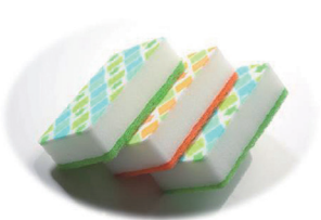
当社の製品と製造機械