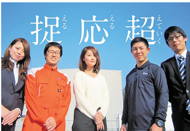
若手社員も多数活躍中です!

今後も既存事業とのシナジー効果が期待できる事業創造も視野に入れ、成長してまいります。