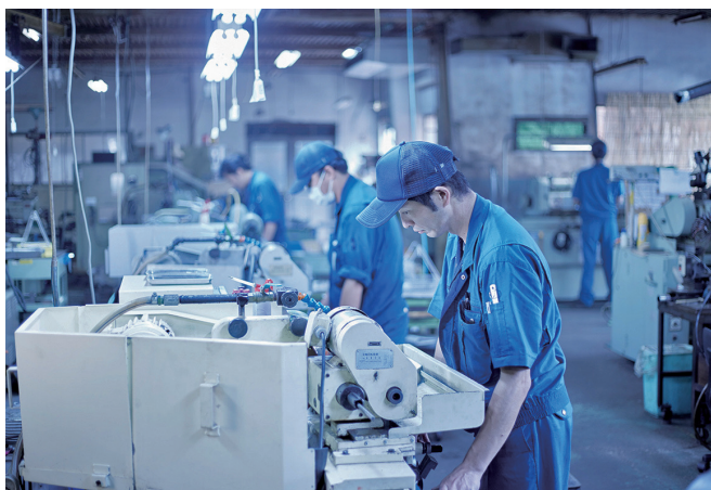
ミクロン単位の作業風景

今までは男性が主に働く場所とされておりましたが、現在は女性も働きやすい環境整備や効率のよい生産方式を取り入れ、女性ならではの多彩なアイデアが生まれる事により新製品の開発が加速しております。