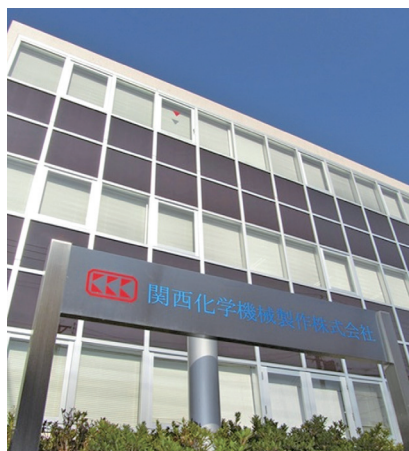
本社管理棟：太陽光発電を壁に施工して省エネ

た装置やシステムを多数開発してきました。例として、高性能蒸留塔(リフトトレイやチェンジトレイ)、溶剤回収で高い省エネ効果を発揮するウォールウェッター、WWムートンなどがあります。これらは化学工学会学会賞や分離技術賞、発明大賞、科学技術庁長官表彰などを受賞しています。