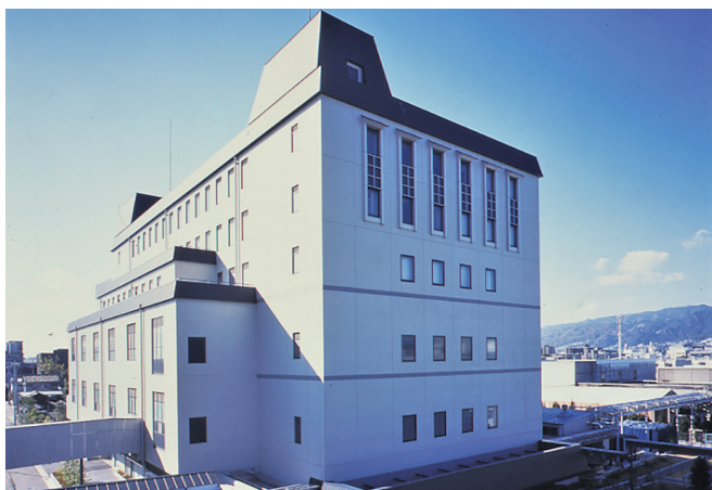
大関の本社工場です

活かし、近年では日本酒にとどまらず、食品や化粧品など酒造りの技術を活かしたモノ作りを行い、総合食品メーカーとして日々開発に取り組んでいます。先人たちが さきかげ より継承されてきた さきかげ 魁精神を重んじ、“楽しい暮らしの大関”を企業理念に掲げ、人々の日々の暮らしに寄り添う企業を目指しています。