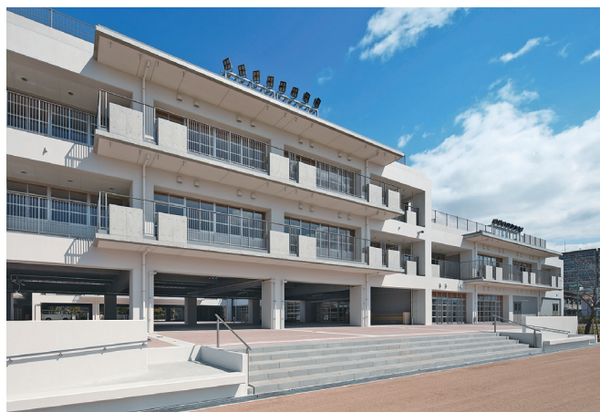
「難波の梅小学校改築工事」建築竣工物件

これからも「IF」から「TRY」に」のローガンのもと、チャレンジ精神で変革の時代を乗り切っていきます。