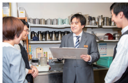
バックヤードで客室部のスタッフと朝のミーティング。その日の業務内容などを確認します。

昨年には、勤務先近くの社員寮から豊岡の市街地に新設された寮へ転居。通勤時間は車で15分かかるようになりましたが、日常生活に必要な物は近所でそろうので便利になったと感じているそうです。ふるさとかから離れた地で着実にキャリアを積みながら、充実した日々を送っています。