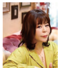
作家 高殿 円