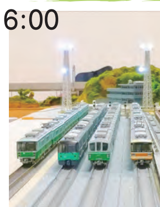
協力:神戸鉄道クラブ