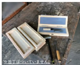
※包丁はついていません。