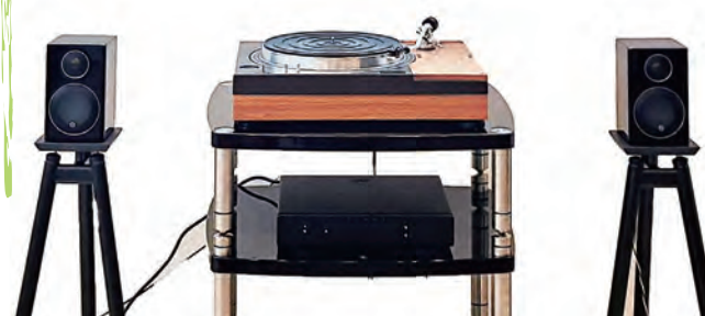
※写真はイメージです。 協力:日本精機宝石工業株式会社

但馬から世界へ輸出している メーカーのレコード針と 一般的なレコード針との 生み出す音の違いをお楽しみください。 (上記期間は、お持ちいただいたレコードの試聴もできます) ※企画展開催中は随時、試聴会を実施します。