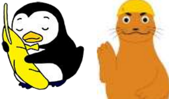
更生ペンギンのホゴちゃん ・ アシカ親方

平成 26 年に協力雇用主として登録、保護観察等対象者一人一人の境遇や能力を的確に把握され、適切な指導と熱い心でその立ち直りに努めてこられました。