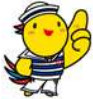
兵庫県マスコットはばタン