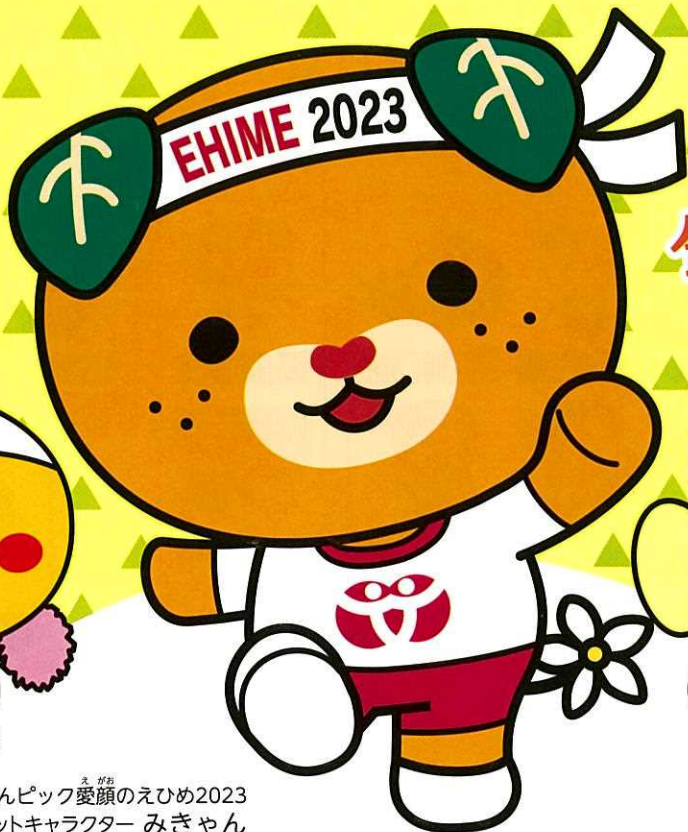
ねんりんピック愛顔のえひめ2023 マスコットキャラクター みぎゃん