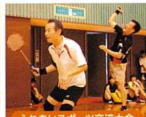
ふれあいスポーツ交流大会