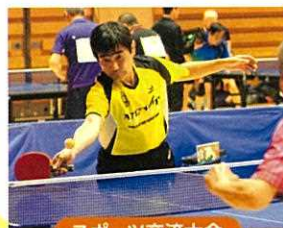
スポーツ交流大会