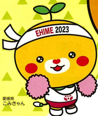
愛媛県 こみぎゃん