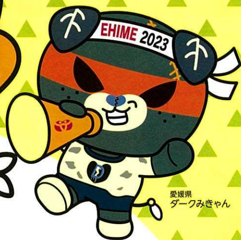
愛媛県 タークみぎゃん