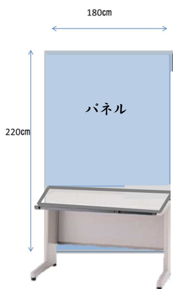
（パネル・机設置イメージ）