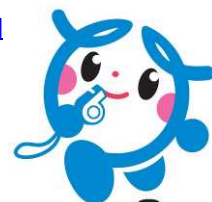
協議会シンボルキャラクター「マモリン」