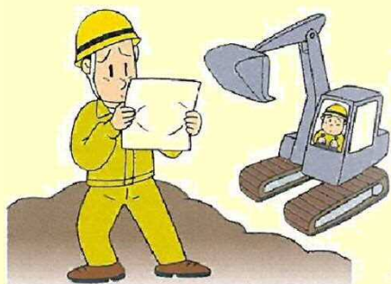
災害復旧に時間がかかる