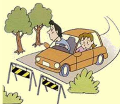
公共工事がなかなか進まない