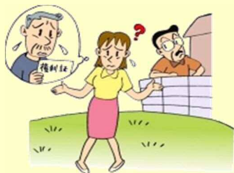
土地がわからない