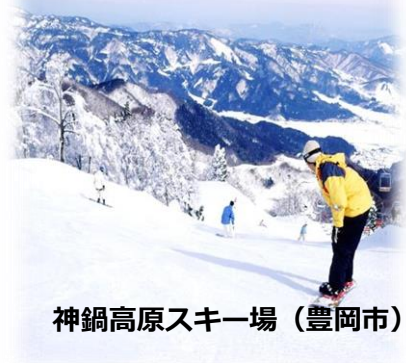
神鍋高原スキー場（豊岡市）