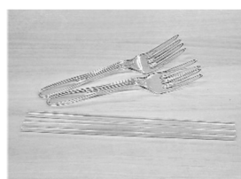
CAFBL0™ で作られた フォークとストロー