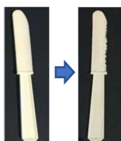
Green Planet™ 製ナイフの 海水中での生分解の様子

協力： 株式会社カネカ … 高砂市内の研究拠点で生分解性素材「Green Planet™」を開発 株式会社ダイセル … 姫路市内の研究拠点で生分解性素材「CAFBL0™」を開発