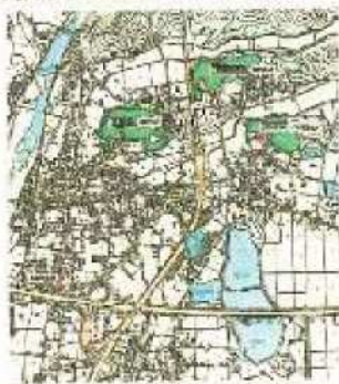
<ふくさき三獅子山ふれあいの森-宮山の森内図>

この森は、「ひょうご豊かなまぶくり緑創」に基づく里山林整備事業の一環として、地元の方さんご協力のもと、道標や距離標等を保全し、御祭場や自然学習の場として活用するため、境内の林相を回復した方々の協力により、林相整備や歩道の整備を行いました。