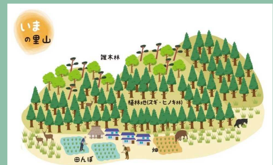
口絵② 現在の丹波の里山