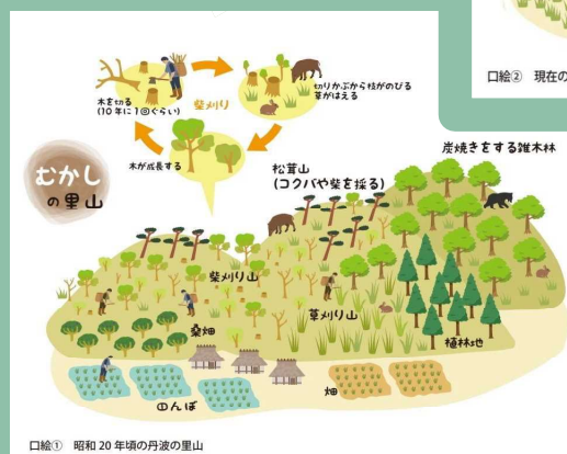
口絵① 昭和20年頃の丹波の里山