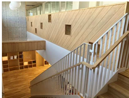
多可町商工会館(多可町) (①室内木質化)