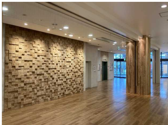
キッピーモール(三田市) (①室内木質化)