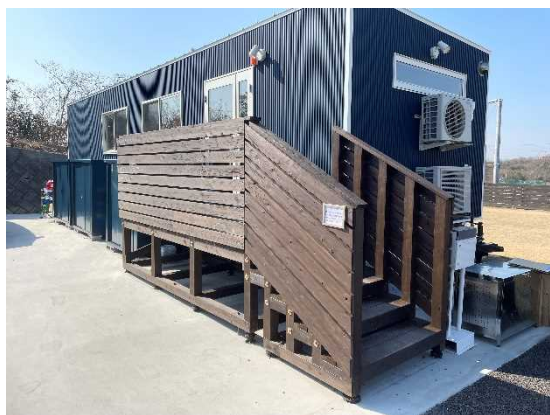
Basara Village Green (神戸市) (②屋外木質化)