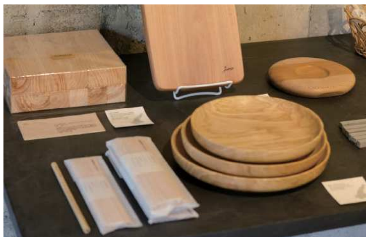
1.洲本市による景観整備のための伐採で開けた大阪湾を望む景色を前に、一級建築士の平松 克啓（左）、林業家の新庄 道（中）、木工家の北島 庸行（右）。2.樹々に囲まれた工房「アトリエKIKI」での木工家・北島 庸行。3.ヒラマツグミ一級建築士事務所 で保管され、使われる機会を待つ地域の伐採木。4.「淡路島の家」で使われた淡路ヒノキの端材で作った鉛筆や淡路島で伐採された木で作った器などの木工作品。（ヒラマツグミ一級建築士事務所のギャラリーにて）