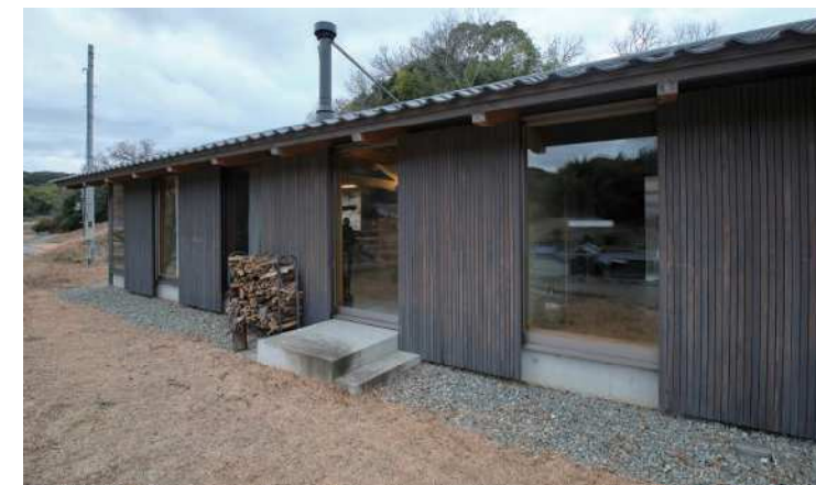
その土地に生え、根ざした家は、いつかその地へ還っていく「淡路島の家」

「昔は先代が植えた木を切って家を建てたという淡路島には、近くにあるものを当たり前に使いたい、という想いがある。そこには世代を超えた物語も生まれる。現在は林業のサイクルをどう作るか模索中だが、同じ想いを持つ人となら、森林との新しい関わり方を見つければ」と話すメンバーたち。歩を進めながら、森との関わりを考え続けている。