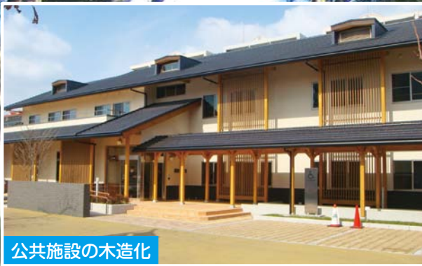
公共施設の木造化