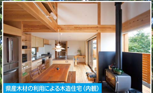
県産木材の利用による木造住宅(内観)