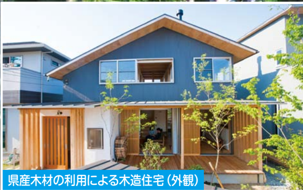
県産木材の利用による木造住宅(外観)