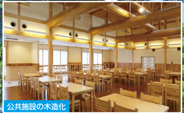
公共施設の木造化