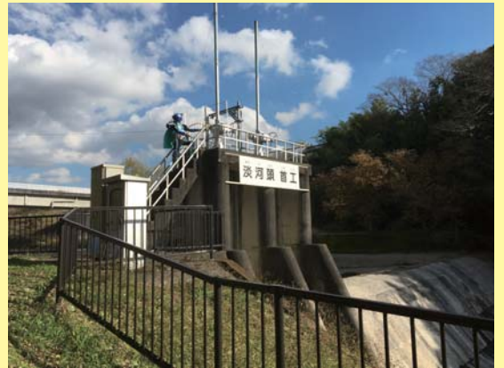
淡河川頭首工とため池マン

石積みで造られた最初の頭首工は、1955(昭和30)年に県営改修事業によってコンクリート製に改修され、1993(平成5)年には国営東播用水事業により取水樋門・土砂吐が改修されています。