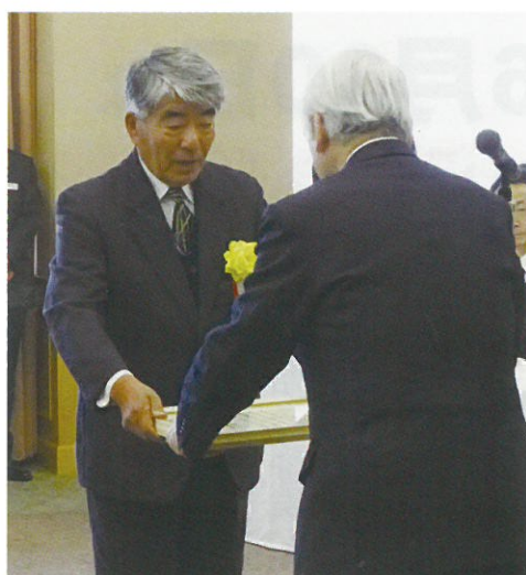
感謝状を受け取る代表者

平成29年3月27日(月)、兵庫県土地改良会館において、ため池管理者に対する兵庫県知事感謝状の贈呈式が行われた。