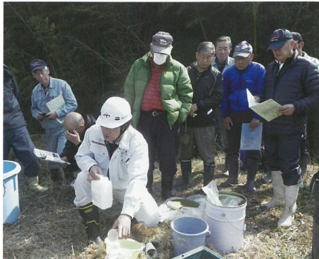
洪水吐の補修法について説明を受ける