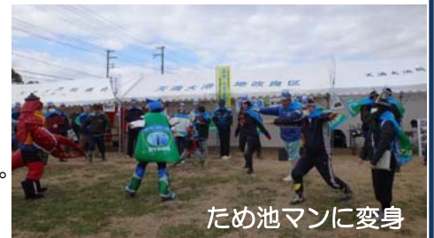
ため池マンに変身

またため池マンとガニオンも参加したため池マン体操も同時開催され、みんなでため池マンに変身もしました！