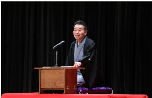
講演「淡山疏水完成100周年」