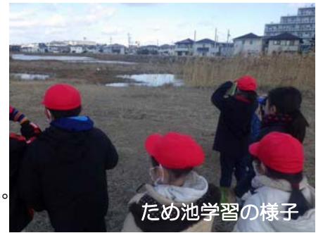
ため池学習の様子

風景は一変し、草は枯れ、水面にはたくさんのカモが浮いていました。色々なカモや、おおきなアオサギ・ダイサギなどを観察することができました。