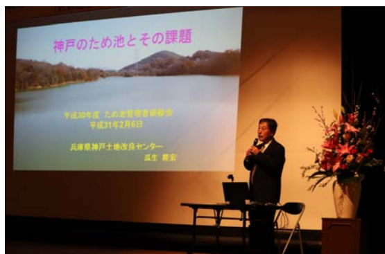
研修会「神戸のため池とその課題」

「神戸のため池の姿」では、西区の約500箇所と北区の約1300箇所のため池について、同じ神戸市のため池でありながら、その形態が大きく異なるのは、河川や地質など自然要因が大きく関係していること、「ため池」はその地域の「歴史」「風土」を特徴つけるものであるとの話がありました。 「ため池をめぐる課題」では、ため池は水利面や防災面から守る必要があるが、近年は特に防災面が重要視されてきて、行政もそれに向けた施策を展開しつつあると説明がありました。 「地域で守るため池」では、豪雨や地震時の備えとして、日常のため池点検・管理が大切であり、これからの時代は、ため池管理者だけでなく、地域全体で多くの人が連携して、ため池を守る時代となってきたおり、ため池を守ることは、地域の歴史、風土を守ることに他ならないと、まとめがありました。 参加した114名のため池管理者は、ため池管理の必要性だけでなく、ため池は、先人から受け継いだ地域の遺産であることを再確認しました。