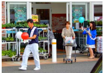
街頭キャンペーン（淡路市）

地域の人たちと管理者が協力して今年度は280カ所で実施 兵庫県では、毎年10月に「ため池クリーンキャンペーン」を実施して、ため池保全のPRや、地域住民等の人たちの参画と協働で行うため池美化・保全活動の支援を行っています。 今年度も約280カ所のため池で実施されます。 10月13日（土）には、高砂市の青池で「じゃこどり」が行われました。当日は子供たちも参加し池の中で泳いだり魚やカメを探するなど、地域の人たちと楽しい時間を過ごしました。 また、小学生や関係者を対象に「ため池教室」を開催し、かいぼりや生き物調査などを行うことにより、身近にあるため池を保全することの重要性、自然保護の大切さなどを知らせてもらおう活動を行っています。 ※クリーンキャンペーンは10月を実施期間としていますが10月以外にも行われています。