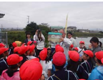
ため池教室（南あわじ市）