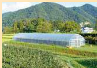
無償貸与されるパイプハウス(同タイプ)