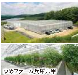
ゆめファーム兵庫六甲