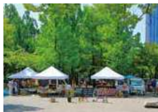
新規就農者も参加するファーマーズマーケット