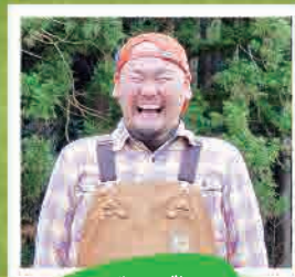
農作業、 めっちゃ楽しんでいます!