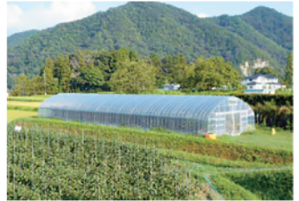
無償貸与されるパイプハウス(同タイプ)

宝塚西谷地区は、農業生産に最適な立地条件があるだけでなく、近くに直売所があるなど販売にも適した地域です。そんな環境の中で、市が提供してくれる無償貸与パイプハウスを利用し、野菜作りをしています。試行錯誤の毎日ですが、経験豊富な認定農業者からの指導を受け日々頑張っています。