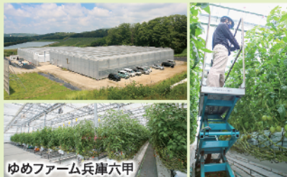
ゆめファーム兵庫六甲

未来の農業経営者を育成するため、「ゆめファーム兵庫六甲農業経営者育成塾」では塾生を随時募集しています。まずは1年間、環境制御システムを導入し水耕栽培を行う最先端園芸施設で働きながら高度な技術を学び、2~4年目は、檀谷地区で農業知識・技術、実践的農業経営など、栽培経験者指導のもとで学び、独立に必要な全ての知識を身につけます。卒業後は、農地取得など独立経営に向けた関係機関からのサポートも充実しています。トマトのプロ農家を最高の環境で目指しましょう！