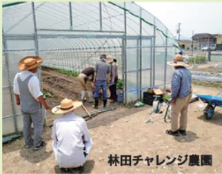
林田チャレンジ農園