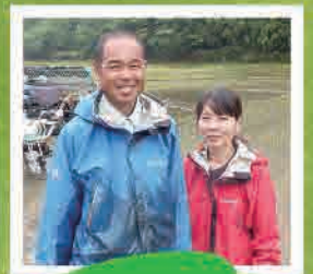
無農薬で、美味しい お米を作りたい。