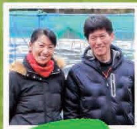
女性農業者も がんばっています!