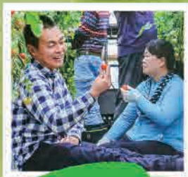
濃くて甘いトマト 育てています!