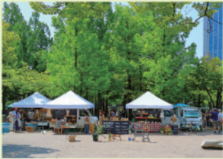
新規就農者も参加するファーマーズマーケット