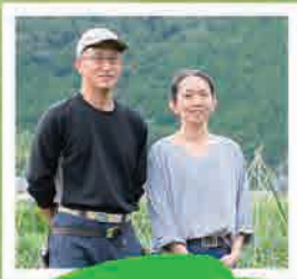
夫婦で露地野菜を 育てています