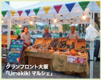
グランフロント大阪「Umekiki マルシェ」