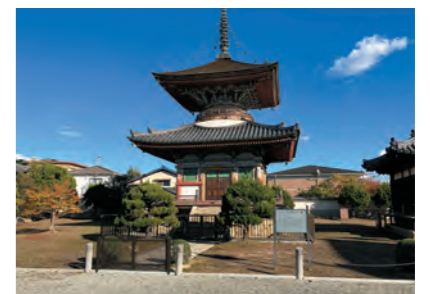
全国で最も美しいといわれる国指定重要文化財の多宝塔