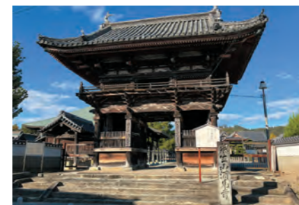
江戸時代後期に建造された楼門

酒見寺は、天平17年(745年)に行基がこの地を訪れ、酒見明神の神託により伽藍を建立したことに始まると伝わる古刹(こさつ)です。境内には、楼門や引聲堂、地藏堂、多宝塔、観音堂、本堂、鐘楼などが並んでいます。