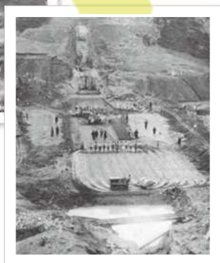
堤体の基礎工事の様子