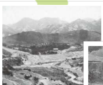
着手前の昭和池付近の様子

あたりは静かで、天気の良い日には水面と山と空のコントラストが美しく、すばらしい景観です。