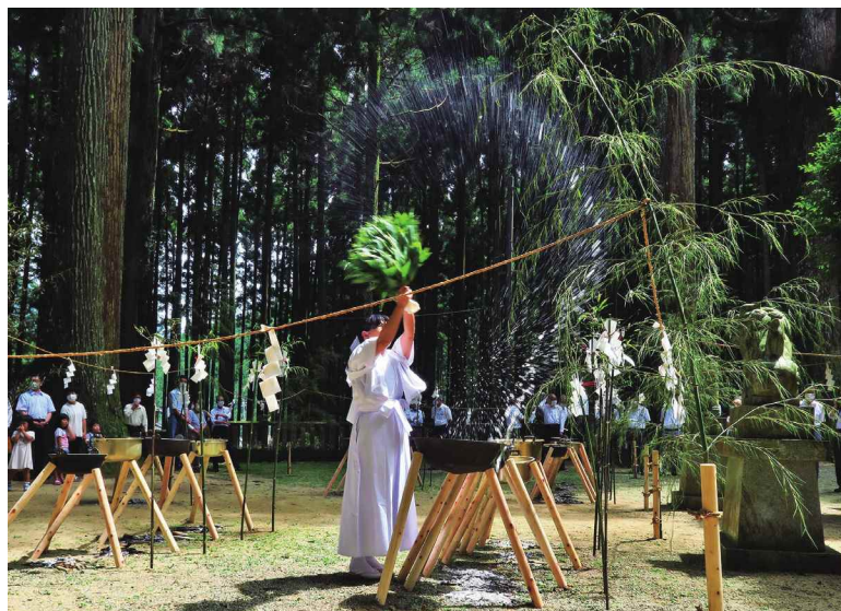
撮影場所：多可町 鳥羽青玉神社

今年はコロナによる影響による関係者のみと近所の人たちは少なくお参りしての湯立てでした。