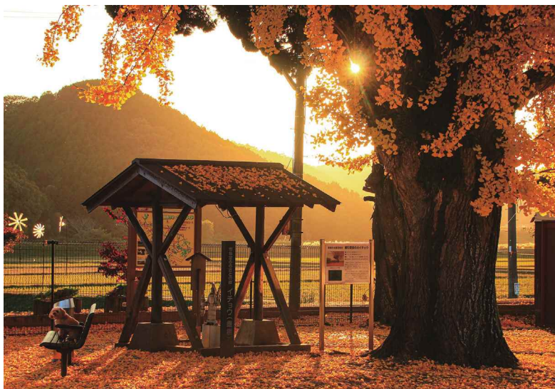
撮影場所：加西市 網引駅大銀杏