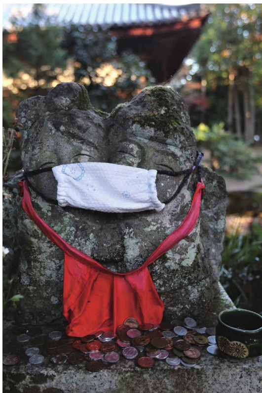
撮影場所…三木市 伽耶院

伽耶院は一年を通して散策できる古刹です。沢山のお地藏さまもにこやかに私達を迎えてくれます。コロナが収束しない今、お地藏さまもマスク姿で佇んでいます。