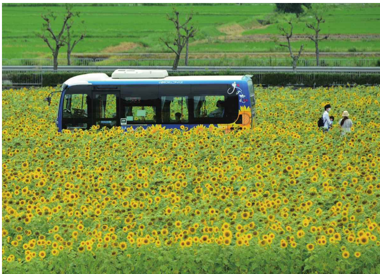
撮影場所：小野市 ひまわりの丘公園