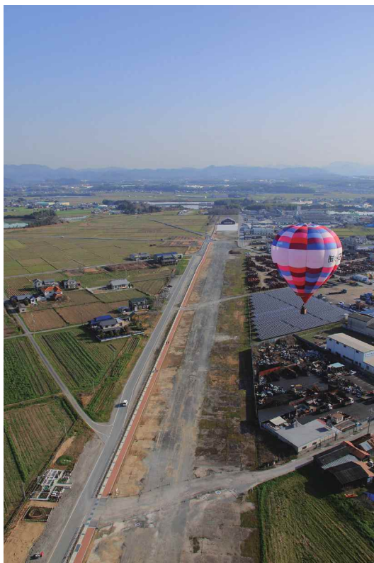
撮影場所…加西市 鶉野飛行場跡