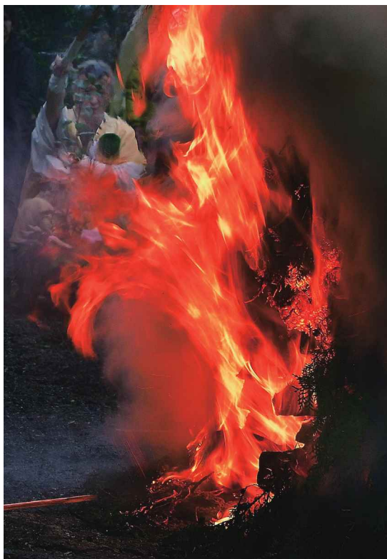
撮影場所…三木市 東光寺