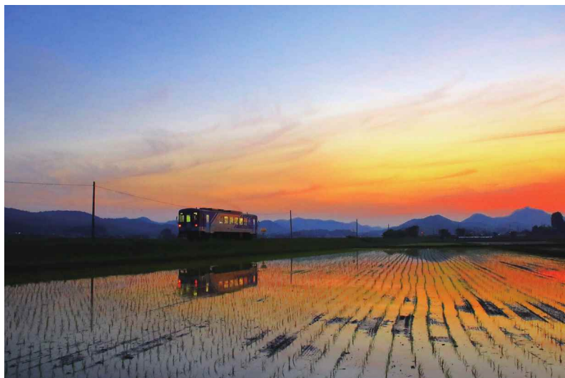
撮影場所：加西市 北条鉄道網引駅付近

夏にはひまわり、秋にはコスモスが咲きほこります。お花畑の中を通る道にバスが。まるで花の波をかきわけながら進むよう。