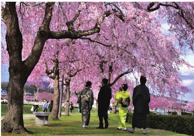
撮影場所：加東市 千鳥川付近