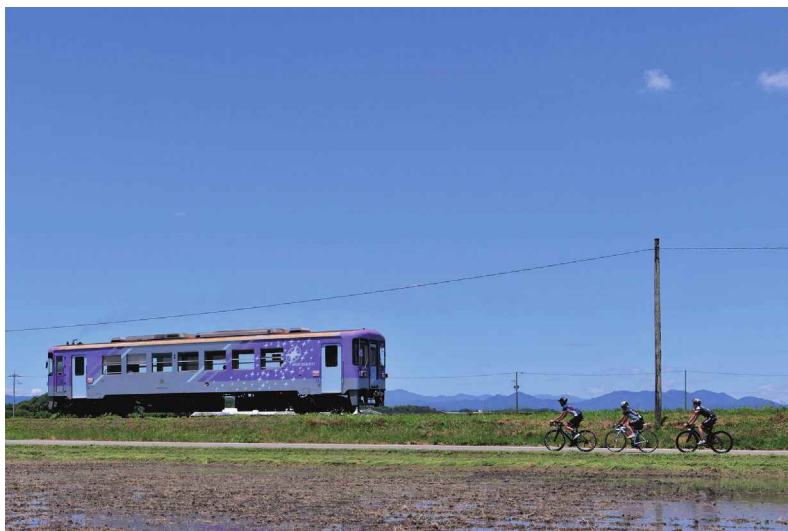
撮影場所：加西市 網引町