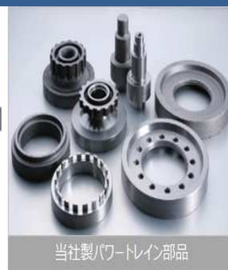
当社製パワートレイン部品