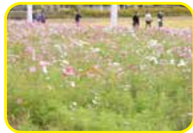
河高地域づくり委員会